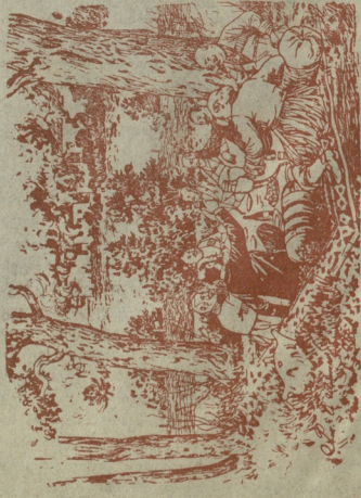
თავადლების ქეფი, მამულელების ღაგრაგების უმეღე.