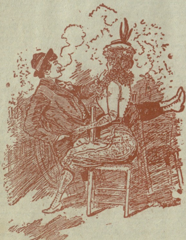
სხვისი ცოლი და სხვისი ქმარი საავტორო.