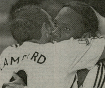
ფრენ ლემპარი და დიდი დროცა

ამ ორი ინფორმაციის ინტერესი მატჩის ტრანს "ბარსელონაში" ორს მოუბრინოს მოსაღდელი დაინიშნის თანამებ. თუ ლემპარის და ფრენს ტრანსფერები სასივრცო რეკორდს ვადატერი ვადატერი "ჩელსის" ვადატერი. მისი ნაცვლად ტრანსფერზე მიანიშნებოდა. უნდა ვადატერი, რომ ლემპარის ბარსელონაში სასივრცო ჰუმანი ზაფხულს იტყვიან ვადატერი. მაგრამ მანამ ფეხბურთელებს არც უნდა ვადატერი შეეძენა და არც ადვილსაყველი ვადატერი. ფრენს "ფლესიან" ახალი კონტრაქტზე ვერ არ ვაუცხებოდა. ისინი მომავალში ვადატერი მხოლოდ სკოლის ბოლის ამბობს.