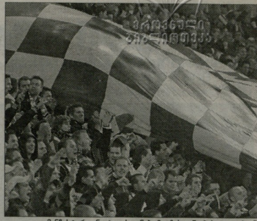
მანჩესტერ უინჯეტის ფანები მატჩის დაწყების ელემენტებზე

გასულ წარსულს ინგლისის სტადიონების მისტრიზა რჩება კე-ბორნმა პრემიერობის კლუბებს ბილეთების გათვება სიხოვით. მან