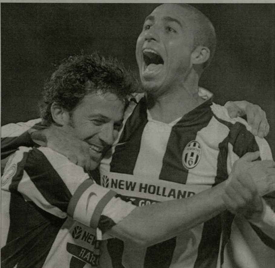
დავიდ ტრეზევესთვის იდეალური პარტნიორი ალესანდრო დლო პირი

- ტრეზევე, რატომ რჩები მუდმივად ნაკრებს მიღმა? - რა გითხრათ... მოვივე ვერბოსა და მსოფლიო ჩემპიონატები, ვიამბობს პლანეტის ერთ-ერთ უძლიერეს და პრესტეჯულ კლუბში, აღარაფერს ვამბობ თავად სერია A-ზე. ამისხნით, მეტი რაღა უნდა დავამტკიცო? ძალიან მინდა, რომ ნაკრებს გამოვადგე, მაგრამ სწორად გამოვიდა, არ მინდა, ვყო მებუთო ფორვარდზე, როგორც ეს ბოლო მუხიდალზე მოხდა. ამას გარდა, ამ მოტივაციის საკითხიცაა. ათი წლის წინ, მზად ვიყავი, ნაკრების გულსთვის ყველაფერი დამეთმო. მაგრამ ახლა უკვე 30 წლის ვარ, ბერი გააკვივე და კიდევ ვადიდებ. მამანია, რომ საფრანგეთის ნაკრებს, როცა კი მოახებდნენ, ყველაფერი მოვეც. თუმცა დღეს ვეღარ ვგულობს მოტივაციას, რომ ერთვინელ გუნდში თამაში ვაკვირდელო. მწვრთნელმა სხვა ფეხბურთელებზე გააკეთა აქცენტი. ამიტომაც არ მეთინია, რომ იერი 2008-ის განაცხადში მოხვდები. ზღაპარი! დღეს ჩემი ერთადერთი სახლი "იუვენტუსია". - როგორ ფიქრობ, მაღლვე ჩემპიონატის ბოლის 30-გოლიან ნინდელს? - ვივლი, რომ ეს შესაძლებელია. ორი წლის წინ ლუკა ტორინი 31 გოლი გატანა. ის უნიკალური ფორვარდია. ცხადია, ამ ნიშნულზე ვასლო ურუელეი ამოცანა იქნება. მე თუ მითიათუ, გაკვირვებულნი მნიშვნელოვანი იქნება, თუკი დღე პირი და იაკურნტაც გაიტყნენ გოლებს. ასეთ შემთხვევაში, ეს უფრო ნაადვირად "იუვენტუსს", ვიდრე მარტო ჩემი ბომბარდრობა. თანაც, დღეს ალექსი ბრინცივალე ფორმაშია. ის იდეალური პარტნიორია, ხშირად იწყებს შეტევებს მოედნის სიღრმიდან, ცდილობს, დირიჯორის ფუნქციები შეასრულოს და შეტევები დაავიოვიონის. სხვათა შორის, ის ფსიქოლოგიური კონტაქტი ჩინებულად ვამოქორბება. ის ეს ახლად მიტყნის ნიშნებს.