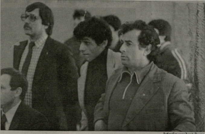
მარჯვნივ გივი ზაუტაშვილი

მირის გურამ პაპიტაშვილის სახელობის დარბაზის სტუდენტობის ხშირად მინახავს მეგობრების ვარიანტის დროს ტიტაშვილს მყოფი ცნობილი მწერალი გივი ზაუტაშვილი - კაცი, რომელიც დღეს 70 წლისაა და უკვე დასრულებულია მისი ცხოვრების განმარტებითი მსოფლიო სპექტაკლები ისე დაბრუნდა ხოლმე ტიტაშვილს, ძუღლის უფლებდელთა უკვეთის ფონზედნი დაიწყო მორიგე სამართავი გაგების დღეები.