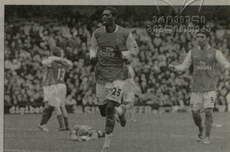
ვენგარული ადვანსორი არსენალის ახალდამამბევილი ლიდერი

არა მხოლოდ ის, რომ გვერს გოლი ვა-ეჭს, არამედ ისიც, რომ რიკ მომენტებ-ში, შეუძლია, შევლეთ მთაზღვის ფლანგზე ნაკატურებს და ამით სტეფის სა-მოქმედი არეულ ვაგზანებს. თუ ვახ-სოვი, როდესაც ის ჩვენიან ადამიო-ვად, ძალიან უჭირდა კონცენტრაცია, უსაშველოდ ვანივლიდა ყოველ ვაფუ-ტბულ მომენტს, ახლა კი მუთის მართ-ვაკ ვააუშვებობს. შეტევების დავარ-გინებაც და სწრაფად აზორენებასაც შეეყრა. ჩემთვის სულად არა მნიშენ-ლოვანი, რომ ფეხბურთელი ბომა-რდითა დავაში ლიდოვრდეს. იყო წლე-ბი, როდესაც პრემიერლიგის იყო წლე-ბი, მაგრამ ვერაგონი ვებედებოდა. თუ ვანსელდა ჩემს ვანკარულე-ბა ვადამარცხებოდა, რომ თამაშის რეა-ლურად ვადებო. თამაშებში, რომ ჩემს ფორვარდებს ვიხივ, კონცენტრა-ცია მოახდინოს ვენსულ სანკონტრე-ბე ადამიანი მუდმივად მუშაობს საკუ-