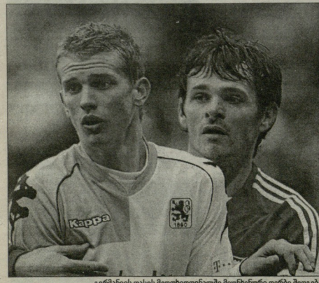
გერმანიის თასის მფობედინალები მუნხენერ დერბი შედეგად

- დიხ, რეპორტო, რა თქმა უნდა, ძალიან კარგი ფხზებრძოლია, მაგრამ პიტცელდის მიხედვით რაფინირების გამო დაბრუნდა, რომ ის გამოცდილია და დამბრუნდებო აქვს სული. - ასაკოვან ფხზებრძოლებთან მუშაობა გაიფხუბება? - არა, მე ნებისმიერი ასაკის ფხზებრძოლიდან თანაბრად ვტყუობო. ხშირად ვაფიქრობ, რომ ერთ დროს "გერმანიის" რუდი ფოლტრის, კალსონის, რიდეუს, ფრანკ ნოიბარტის და მარკო ბოლდს საბით 20 წლის ბიჭები მოიტყვნენ ეს მოთამაშებო. მიუხედავად მსოფლიოსა და ევროპის ჩემბიონები გახდნენ. თავის დროზე, "კაიზერსლუტი" მუშაობას სწორედ მე ვიყავი ის მწერალი, რომელიც მთრლხუდა კლზე და მისაღებ ბარკო მოვიტარებო. ახლანდელი მთრლხუ გუნდში დაგაფიქვანა. ეს ჩემი სიმართლეა.