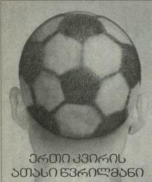
ერთი კვირის ათასი წვრილობანი

ერთი თვე და ჩვენთან საფეხურ- თი სეზონი განახლდება, ეროვნულ ნაკე- რები კი უფრო ადრე დაიწყებს წვლილას - 6 თებერვალს ლატვის დასუფილება ამ- ხანაგვრად. სეზონის განახლების მოახ- ლოება თავისებური ფორატი ახლავს.