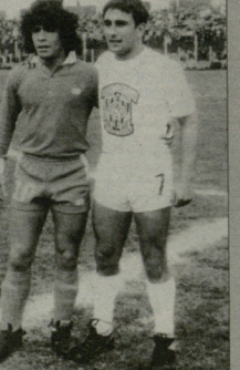
სამონტაბატი ქალაქის მცვენი: 899 23-55-20

დანერვილებით ცნობებისთვის მსურველები უნდა გამოცხადდნენ მისამართზე: თბილისი, ლეონის ქ. 4 (თავი- სუფლებლის ნორდანი, ეროვნული ბანკის მშობრდანი). მსურველთა მიღებას ანარმობებს ყო- ველგნის წარმომადგენელი საქართველოში, მიმდინარე 25 იანვრიდან 25 აპრ- ილამდე 13 საათიდან 15 საათამდე, კვირის გარდა. ფეხბურთელთა არგენინის ვიზის მოგებაზე 28 იანვრიდან და მათ ვარჯიშები არგენინაში დაწყებაზე 1 თებერვლიდან.