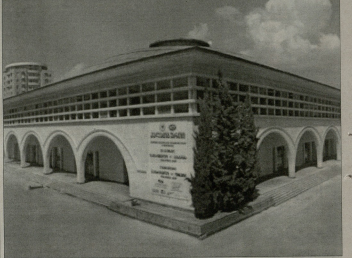
თბილისის მთავრობის თანხმებით, 26-27 იანვარს