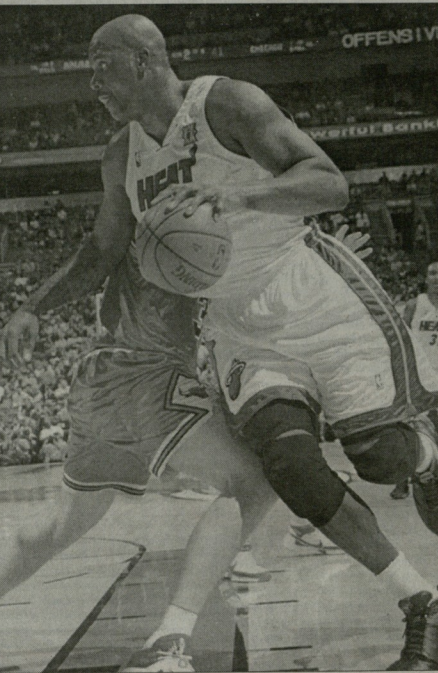
პაკი დაბრუნდა, მაგრამ...

“ნიუჯორკი” 11 ნაჯი, ვეღალზე ძირ-დადრეზული მოთამაშის დაბრუნე-ბის შემხვედრება, კოლდედ უორსა-ტეტი-ვი მოუდრნება და ფლეი ოფში გას-ვლის ნულეული პრესტიჟისა - ასეთია “მაიაში ბიტი” სასაქონლო რეკლამა და ნაჯილები საგარეოდა, უკეთესო-ბისეკ რაიმე შედეგად.