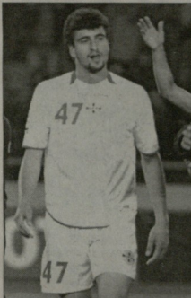
კვახაძემ შესაძლეს სესონი ერთ ვოროჯიანი ჩამთავროს

„მის ვოროჯიან“ სესონის მეორე ნახევრისთვის სამზადის მ ინაერის შედეგად, მან ერთი ანაბეგური მატჩიც არ გაუძარიათ. ამის მიზეზი თბილისური დივიზიონი, რის გამოც „ვოროჯი“ მხოლოდ ფიზიკური მიმზადებითა და