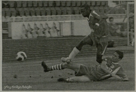
ერეი როსოვი ჩასევი

„დინამოს“ პრეზიდენტი გინდლო ინასაც გაუწვდის, ვისაც შეიძლეოს