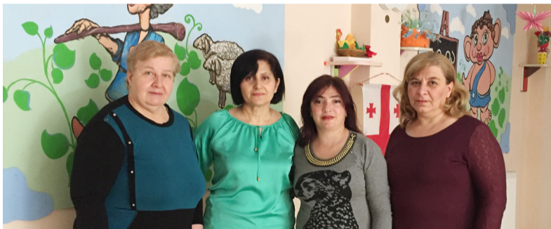
სანჰიგიენის კოორდინატორი - მზარეულებთან

„ბაღს მაღალკვალიფიციური დირექტორი და პედაგოგები ჰყავს. ბავშვი ყოველთვის სუფთა და მოვლილი ბრუნდება შინ. გვანცა განვითარდა და დაეხვეწა მრავალი უნარ-ჩვევა. სახლში