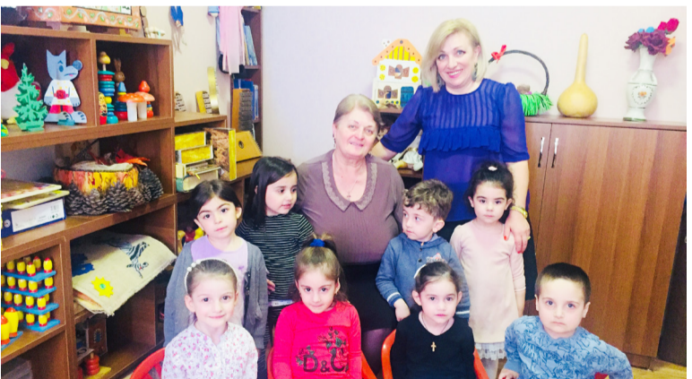
დირექტორი - პატარებთან

ეგებ, ცოტას ვაჭარებ? თუ ასეა, მშობლების მრავალ სამადლობელს რა ვუყოთ?