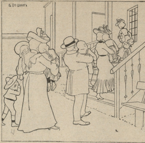
ქართული წარმოდგენა სახალხო თეატრში.