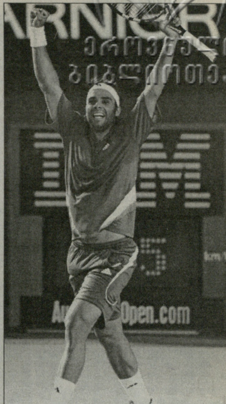
გონსალესი პირველად გაივინა დიდი სლემის ტურნირის ნახევარფინალში

მას ასე, გაირკვეა ყველა იმ ჩოგბურთელის ვინაობა, რომლებიც ავსტრალიის ღია პირველობის ფინალში გასასვლელად იბრძოლებენ. გუშინ ნახევარფინალში თამაშის უფლება მოიპოვეს: გერმანელმა ტომი ჰაასმა, ჩილელმა ფერნანდო გონსალესმა, ზელანდიელმა კიმ კლაისტერსმა და რუსმა მარია შარაპოვამ.