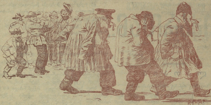
თბილისის მიკიტნების ჩივილი.

— ღმერთმა უშველოს ამირავს, რომ დავეტკო თბილისის მოქალაქენი ამ დიდ მარხვანი.