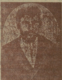
მ. ი. ფირცხალაიშვილი.