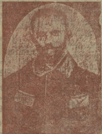
გ. შ. მეტრეველი.