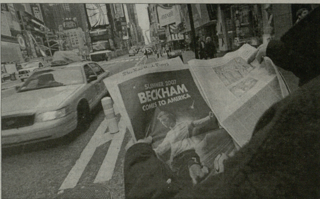
სარეკლამო კამპანია დაიწყო: ნიუ იორკ ტაიმის მკითხველს აუწყებს, რომ ზაფხულში ბექემი ამერიკაში ჩავა

ლაის" ცოცხალი ლეგენდის, პაოლო მალდინის ამერიკაში გამგზავრებაზე? ან მისხელ ბალკის ტრანსფერზე, რომელიც "ჩელსიში" უკვე პენსიონერით გამოიყურება?