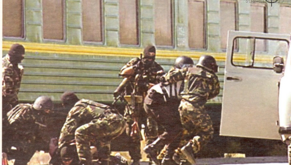
სომხეთის საექცდანიშნულების რაზმი საქოპერაციას აზორციელებს

მაღზე საინტერესო რეალობა იკვეყობა უკრაინაშიც. საპრეზიდენტო არჩევნების შედეგად ერთი კითხვა ვაზა ვევლავზე აქტიურია: საით წავა უკრაინა?