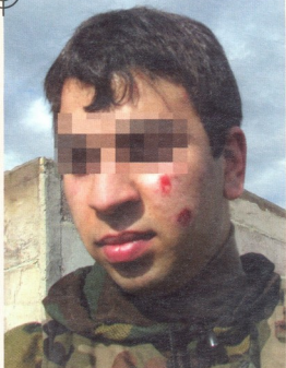
სახის სპეციალური დამცავი ნიღბის გარეშე არისოფტის თამაში შეიძლება სახიფათო გახდეს, რაზეც ეს სურათიც მეტყველებს

ფილიტრულ სამხედრო ფორმით არიან შემოსილნი და ფეხზე მალაყელიანი ფეხსაცმელები აცვიათ ფორმა შენიღბას უზრუნველყოფს, რაც თამაშისას ძალზე მნიშვნელოვანია. ერთ გუნდში გაერთიანებული მოთამაშეებს ერთმანეთი ფორმა აცვიათ და ამით სხვა გუნდებისაგან განირჩევიან. ასევე ხშირად გამოიყენება სხვა გამოსაცმობი ნიშნები. მაგალითად, მკლეხა და გულზე დასაბეჭებელი ემბლემები.