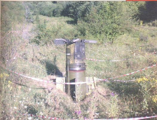
რუს მერავეტუთა მიერ შეტყობილ დასაბოძებულ სამხრეთ რაჭის ტყეში უკაცრიელი ადგილი აღმოჩნდა

ობერატიული-ტაქტიკური კომპლექსი Точка სტარტის წინ