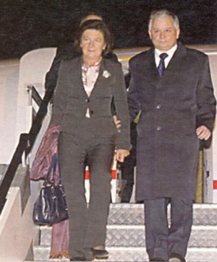
პოლონეთის პრეზიდენტი და მის მეუღლეს თეთიმფრანკის ტრაპიზიდან ჩამოსვლა არ აცალეს, ვრთა თუ არა ამ ტრაგედიაში რომელიმე სპექსამსახურის ხელი?!

ოდივან ავი ფიფია – ქვეყნის რეალური საგარეო-პოლიტიკური კურსის წმირად დიპლომატების ღამან-ღამანში სიტყვების მიდმა იძალუბა. ამიტომაც შეარქვეს დიპლომატებს ტყუელის თქმის დილისტატეტი.