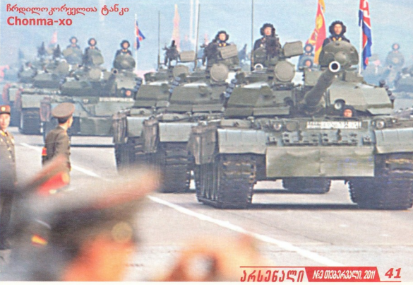
ჩრდილო კორეული ტანკი Chonma-xo

2002 წლის აღლუმის სახელე M2002 (Pokpung-xo) იყო. სპეციალისტებმა