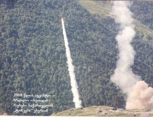
2008 წლის აგვისტო — ჩრდილო ოსეთიდან რუსები საქართველოს „ტოჩკებს“ ესვრიან