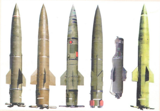
ფოტოში ჩამოვარდნილი და აფეთქებული Точка-У ძრავას ნაწილი