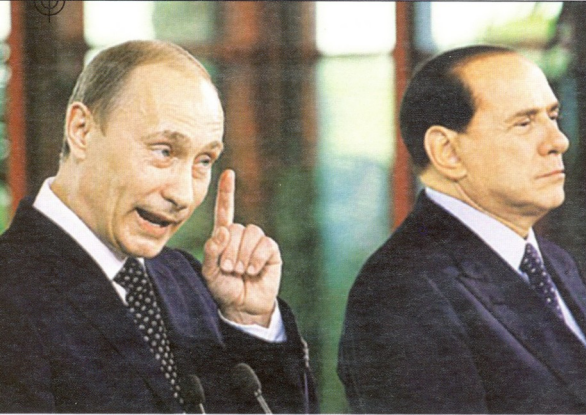
ბერი ექსპერტი და ანალიტიკოსი პუტინ-ბერლუსკონის დიდი „მშობა-მგობრობის“ მიღმა სხვა, ათეული წლების წინ დაწყებულ უფრო „მარტვ“ და პროზაულ კვლევებზე

ლობას. იტალიაში საზოგადოებრივი დაპირისპირება გამწვავდა. ამ სენსაციების „შემოქმედი“ ვასილი მიტროხინი კი 2004 წლის ანერის ბოლოს, 81 წლისა გარდაიცვალა ლონდონში.