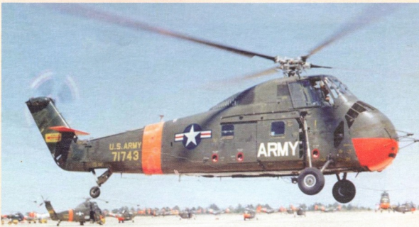
სიკორსკის საუკეთესო კონსტრუქციის შეუკუმფერნად S-58 დარჩა