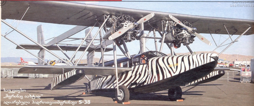
საუკეთესო „მფრინავ იანტად“ აღიარებული პილროთვიომფრინავი S-38