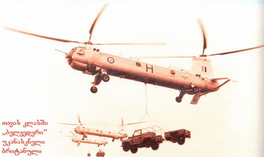
თუის კლასში „ბულვარდერი“ უკანასკნელი ბრიტანული მოპოკანია

ნელი სერიული ბრიტანული შვეულმფრენი აღმოჩნდა.