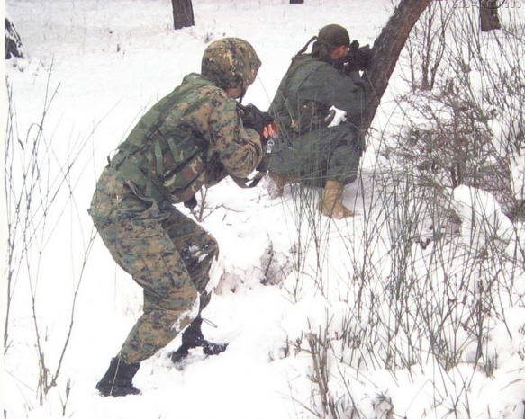
სამხედრო თამაში ნებისმიერ ამინდში მიმდინარეობს

მეკავრელები სტანდარტულ იარაღს ზინიდან მფრინებებს უტარებენ და დამხმარებით სროლის მანძილს, სროლის სიჩქარეს, ტყვიის საწყისი სიჩქარესა და სხვა მახასიათებლებს აუმჯობესებენ.