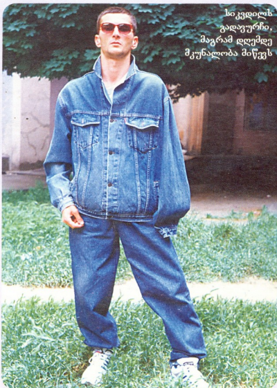
სიკვდილს გადაურჩი, მაგრამ დღემდე მკურნალობა მიწევს