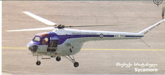
მსუბუქი ბრიტანული Sycamore

ამგვარმა კონსტრუქციულმა გადაწყვეტამ ხრანხების ჰაერის მასაზე დაერწობის ფართობი ორჯერ გაზარდა, აპარატებს გარე საკიდზე ერთ-