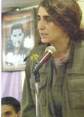
ქურთი ქალბები პარტიზანულ ომში მამაკაცებს არ ჩამოუვარდებიან

„ქურთისტანის მუშათა პარტიას“, არც საერთაშორისო და არც თურქეთის მასშტაბით, პოლიტიკური მხარდაჭერა ნაწყვილად არ აქვია. ევროპულ მასშტაბის ინფორმაციით, ქმ-ის აპოლო-