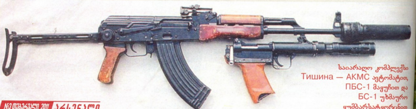
საიარაღო კომპლექსი Тишина — АКМС ავტომატი, ПБС-1 მაგუჩი და БС-1 უხეაურო ყუბუბარსაგყორსი