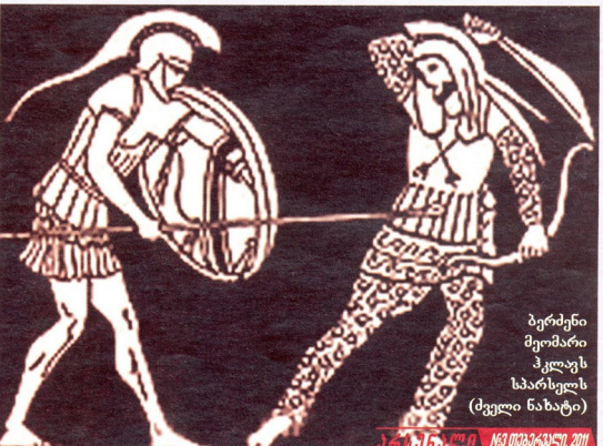
ბერძენი მკომარი კლავს სპარსელს (ძველი ნახატბ)