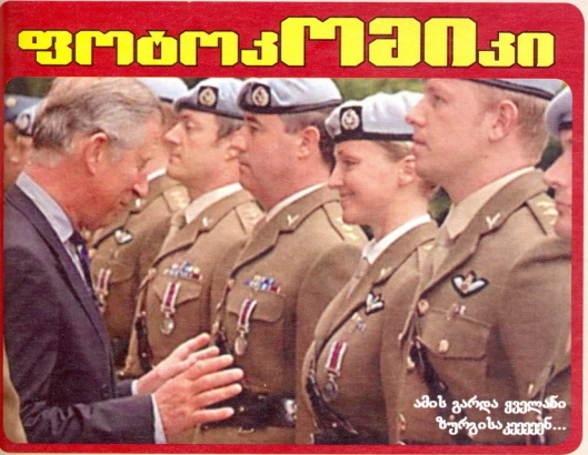
რუბრიკა მოამზადეს სულხან ნაძინაძემ და გელა კორძაძემ

ანდორელი ჯარისკაცი ვფიცვ, პირნათლად მოვიხადო ჩემი ევლი ანდორასა და შენ წინაშე, მამაჩემო. მიუხედავად იმისა, რომ მარტო ვარ ჯარში, ვფიცვ, მაინც შევებრძოლები მტერს, თუნდაც მთელი მონაკოს 5-კაციანი არმია შემოგვესიოს.