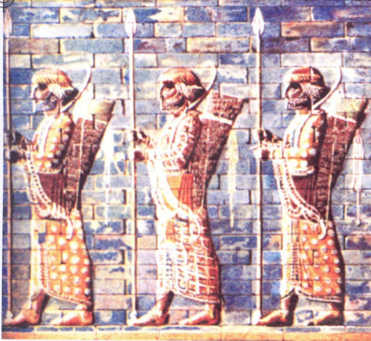
სპარსეთის ელიტარული ჯარისკაცები „უკვადგები“

ბერძნები იმ ეპოქის „თანამედროვე“ მეთოდები იყენებდნენ. საბერძნეთში უდიდესი ყურადღება ექცეოდა ჯარისკაცთა ინდივიდუალურ მომზადებას. სპარსეთში არსებობდა სახელობრივი „სამხედრო სასწავლებლები“, სადაც უმკაცრესი დისციპლინითა და ფიზიკური დატვირთვით მომავალ მებრძოლებს 7 წლის ასაკიდან ამზადებდნენ.