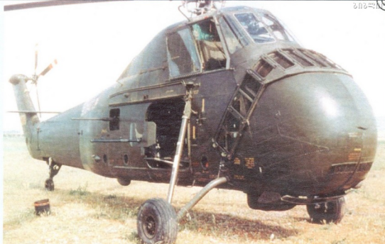
S-58-ზე ტყვიამფრქვევების დაყენებით, ფრანგებმა პირველებმა იმპროვიზირებული „განშვები“ შექმნეს

ყო საბრძოლო დანაკარგიც, ფრანგებისთვის სრულიად მოულოდნელი გამოდგა, რომ შეეუღლმფრენის ჩამოსავლებად ერთი ტყვიაც კი საკმარისი იყო. ერთ შემთხვევაში H-21 ბაზაში მზიიდა ხრანხის ნიჩგებზე, ფიურელაჟსა