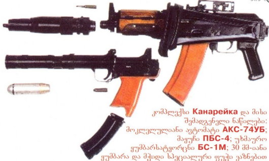
კომპლექსი Канарейка და მისი შემადგენელი ნაწილები: მოკლედულიანი ავტომატი AKC-74YB ; მაქსიმალური ПБС-4 ; უხმაური ყუმბარსატყორცი BC-1M ; 30 მმ-იანი ყუმბარა და მჭიდი სპეციალური ფუჭი ვაზნებით

რაც შეეხება თავად უხმაური ყუმბარსატყორცის, აქ შეტად ორიგინალური სქემა იქნა გამოყენებული. ყუმბარსატყორცნ BC-1M-ს საკუთარი შვიდი აქეს, რომელშიც 10 ცალი 5,45 მმ კალიბრის სპეციალური ფუჭი ვაზნა თავსდება (BC-1-ში კი მხოლოდ 8 ცალი 7,62 მმ კალიბრის ფუჭი ვაზნა იტევოდა). ყუმბარსატყორცის ლულაში წინიდან იდება ერთი 30 მმ-იანი ჯგუფგამტანი-ცეცხლგამწეინ ყუმბარა BOG-T (ან სასწავლო, ინერტული საბრძოლო ნაწილით). გასროლისას ფუჭი ვაზნის დენითს აირები აწევა სპეციალურ დგუმს, რომელიც ყუმბარსატყორცის ლულაში გადაადგილდება და ყუმბარას 170 მ/წმ-ში აჩქარით ავადებს. დგუმში კეტვს ლულას, რის გამოც დენითს აირები ატმოსფეროში არ გამოდის და არც სროლის ხმა წარმოიქმნება.