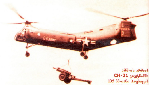
აშშ-ის არმიის CH-21 ვიეტნამში 105 მმ-იანი პაუზის ტრანსპორტირებისას

1961 წლის დეკემბერში ავიატექნიკის სატრანსპორტო ავიამშობმა Cardმა საიგონში შვეულმფრენთა პირველი