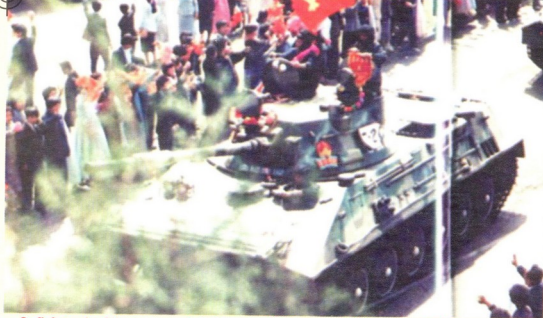
კომუნისტური ჩრდილოეთის პირველი სერიული ტანკი — ტიპი 85

მასში საბჭოთა T-62/T-72-ისა და ჩინური 85-ე ტიპის ტანკის ერთგვარი ნაზავი დინამიკა.