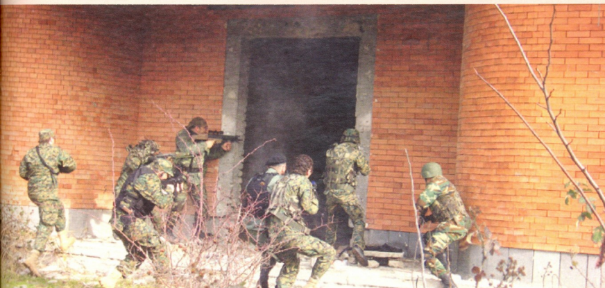
შენიშნის ალბის მომენტო