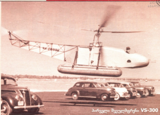
პირველი შეუკუმფერნი VS-300

უიაკიაში ამ ჯილდოს მფლობელი მის გარდა მხოლოდ ორვილ რაიტი იყო.