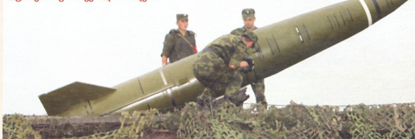
კომპლექსის გათვლა „ტოჩკას“ გასაშვებლად ამზადებს

ენი ეტაპზე ბირთვული ქობინებისა თუ მასობრივი განადგურების სხვა საშუალებათა შემოტანას უნდა ველოდოთ. ეს პროცესი იმის მანიშნებელია,