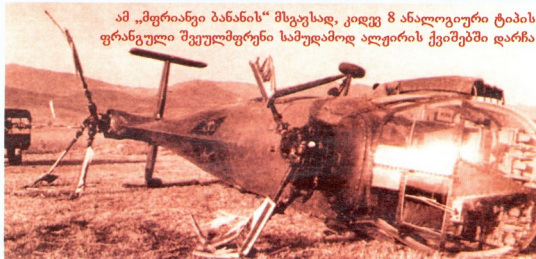
ამ „მფრინავი ბანანის“ მსგავსად, კიდევ 8 ანალოგიური ტიპის ფრანგული შვეულმფრენი სამუდამოდ ალჟირის ქვიშებში დარჩა

ქვედანაყოფები ჩაიყვანა, 30 დეკემბერს კი შვეულმფრენებმა საბრძოლო გაფრენა შეასრულეს და ვიეტკონგელებმა ერთი „ბანანის“ ჩამოგდება შეძლეს. ომის საწყის ეტაპზე აპარატები ძირითადად, სატრანსპორტო დანიშნულებას ასრულებდნენ.