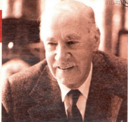
ავიაციის ისტორიაში ივანე სიკორსკი ერთ-ერთ ვეულაზე ნიჭიერად ავიაციის კონსტრუქტორად შევიდა

მომდევნო წლებში ამერიკული სიკორსკების ოჯახს შეემატა „ამერიკაში იახ-