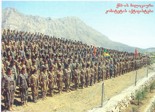
ქმპ-ის მილიციური კომიტეტის აქტივისტები