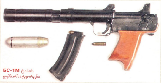
БС-1М ტიპის ყუბუბარსაგყორსი

გახული საუკუნის 70-იან წლებში საბჭოთა არმიის ძირითადი საშტატო ავტომატური ცეცხლსასროლი იარაღის კალიბრის 7,62-დან 5,45 მმ-მდე შემცირების გამო, გენშტაბის მიჯარის სადაზვერულო სამართავლოს ГРУ -ს სპეცდანიშნულების დანაყოფებს ახალი სპეციალური იარაღი დასჭირდა. არის გამოც უხეაურო ყუბუბარსაგყორსის კომპლექსი Тишина შეიცვალა Канарейка -ით.