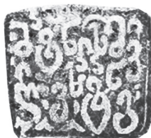
ვახტანგ ბატონიშვილის ბეჭედი. (სსიპ კ. კეკელიძის სახელობის ხელნაწერთა ეროვნული ცენტრი, ხელნაწერი Hd-7335).

„ლიხთ იმერეთის მეფის ძის ძეს, და მემკვიდრეს, იესიან, დავითიან, სოლომონიან, პაკრატოვანს, და ან დიდებულის და ცათა სწორის ხელმწიფისაგან მეფედ ნოდებულს ვახტანგს“. 42 ხოლო თურქეთის პრემიერ-მინისტრის ოსმალურ არქივში მოვიძიე დიდი ვეზირის წერილი, რომლითაც სულთანს აცნობებს: „მოცემული წერილი არის იმერეთის მეფის, მეფე ვახტანგისაგან, ასევე თავადების და აზნაურებისაგან...“ 43 ი. ბიჭიკაშვილი ვახტანგთან დაკავშირებულ ამ ისტორიულ ფაქტებს მალავს და აცხადებს, რომ ტარიელი (და ვახტანგი? – მ. ხ.) არ სარგებლობდა ბატონიშვილის სტატუსით: „...ხოლო მეფის უკანონო შვილის შვილები კი, უკვე თავადის და არა ბატონიშვილის სტატუსში იმყოფებოდნენ, მაგალითად იმერეთის მეფე დავით II-ის (1784-1789) უკანონო შვილი როსტომი, ბატონიშვილის სტატუსით სარგებლობდა, ხოლო მისი შვილი ტარიელი, თურქეთში ცხოვრებისას ატარებდა ჰაიდარ-ბეგის (ბეგი ნიშნავს თავადს) სტატუსს, რაც შემდგომ გაუგვარდათ კიდევ.“ 44 ვახტანგ და ტარიელ ბატონიშვილებს ერთადერთი შთამომავალი დარჩათ – ვახტანგ ბატონიშვილის ასული ანასტასია, რომელიც შემდეგ ნიჟარაძეზე გათხოვდა. ტარიელის მეორე სახელი „ჰაიდარ-ბეგი“ დოკუმენტურად არ დასტურდება. მას შვილი არ დარჩენია. გაუგებარია, თუ ვის „გაუგვარდათ“ ჰაიდარ-ბეგების გვარი? საინტერესოა, რას ეყრდნობა ი. ბიჭიკაშვილის მსჯელობა თავადის სტატუსის შესახებ? როგორც ვხედავთ, ი. ბიჭიკაშვილი ისტორიულ პიროვნებას, ვახტანგ ბაგრატიონს, საერთოდ არ ახსენებს. იყო, თუ არა ვახტანგი – ბატონიშვილი? ამ კითხვაზე პასუხი ადვილი გასაცემია: ჯერ კიდევ თურქეთში გადახვეწამდე, ვახტანგი სიგელებს ამოწმებდა ბეჭდით, რომელზედაც ამოტვიფრული იყო – ბატონიშვილი ვახტანგი. 45