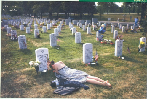
აპრ. 2010. 10 ივნისი