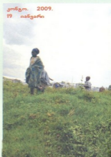
კონგო. 2009. 19 იანვარი