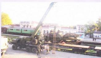
ქართველ პოლიტიკოსებს ორი წლის განმავლობაში ინტერნეტში კარგად რომ ჩაებნათ, ამ სურათს აღმოაჩნდნენ, რომელზეც იღიქმებოდა გუდაუთის სარკინიგზო სადგურზე რუსული C-300-ის ერთ-ერთი ელემენტი — დაბად სიმაღლეზე მფრეხი სამიზნეების აღმოშენი რადიოლოკაციურის ჩამოტეირთვის პროცესი...

თითქმის ორი წელი ფუნქციონირებდა რუსული C-300 ოკუპირებული აუზანებითი ტერიტორიაზე და ოფიციალური თბილისის პროტესტი მანამ არ გაჩნდა.