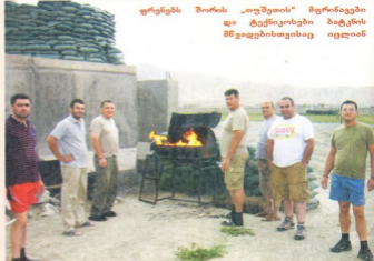
ფრენებს შორის „თუშების“ მფრინავები და ტემპიკობები ბატკის 85 ვადებების თვისაც იცლიან

სიციხის გამო ქაბულის დროით დილის 4-5 საათზე ვეგებთ და 6-7-ზე უკვე ვაქრბთ ვართ იმეთილად, შუადღის