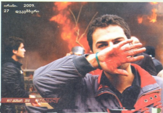
ირანი. 2009. 27 დეკემბერი