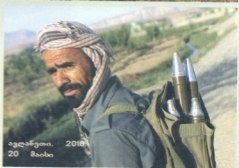
აფღანეთი. 2010. 20 მაისი