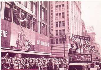
1944 წელი, იანვარი, ლოს-ანჯელესში