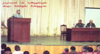
კოკოითში ოს სამხედროების ახალი მინისტრი წარუდგინა

● „მოლოდინის განმარდა შეტების ხაზის გასწვრივ უპილოტო საფრენი აპარატებისა და სახელო თვითმფრინვების საბრძოლო-სასწავლო თუ სადამკურნო მიზნით იყენებენ“. — განაცხადა თვითალაღებელი ყარაბაღის თვდაცვის არმიის პრეზიდენტი, რომლის თქმით, საპარო თვდაცვის ქვედანაყოფი უნარინი მოქმედებით ყარაბაღის საპარო სფრეც ფოელებით დაცული იქნება. გერცელებული ინფორმაციით, ისრაელის წარმოების აზერბაიჯანული უპილოტო აპარატები შეტების ხაზის გასწვრივ დაფრინავენ. სომხებმა მათი ჩამოვლება რამდენჯერმე უშედეგოდ სცადეს.