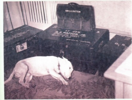
ჯორჯის სიყვარული ბულტერდოერი „კილი“ მისი ერთგული მეგობარი და აშშ სამხედრო სიდიულბოებების უზაადო მეცელიც იყო...

ცუხლზე სეფი დაასხა 1943 წლის 10 აგვისტოს მომხდარს ფაქტს: რაცეა პატონი სეკილის სრლადი სანაბროზე განთიფებულ 93-ე საეფეუციო პოსტატლს ამწმუტად, ერთ-ერთი პალატამ ადმინან ითი რაიოთი ვარისკაცი, რომლებსაც ურდობები არ სქინდი გერჯრადს თინმლებ ქეშმს კეთბა, რატომ იქუნენ ისინი პოსტატლში. დღაწინობს — „სარბარ პირბებუს სრეუელი გამსოფრტა“ — პატონი გააციოო. მან ვარისკაცებს სამხედროტეხი უწოდა, პოსტატლზე ამიდილი და ერთ-ერთი მათგის სანეში ჩარტრტა. პალატდინ გასდლისას კი, რაცეა მოიხედა და დანახა, რომ მის მთერ შუქრატეფიული ჯარისკაცი დღინზე წამომგვარინ ტრბოდა, დაბრუნდა და შეროდ ჩარტრტა პოსტატლზე, ახერად თვისი. შეროდ დარტების მონტეპბი არა მარტო გეშინი და ექსინება, არამედ ხმურზე შესოკეწინალი უწარალისტეხიც გახდნენ. მომხდარის დანადგა შუქრებელი იყო, რამდენიმე დღის შუქვდ გერჯრდის აღმსოფიობელი საქეულის შესახებ მიედლს ამერიკამ იციდა. განტოთი თეგავსელი გერჯრდის ამერიკამ დაბრუნებას მოითხოვდნენ, თუცა ეთინ-