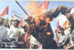
ინფორმაცი: 2010. 7 თებერვალი