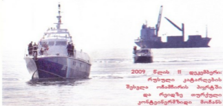
2009 წლის II დეკემბერი: რუსული კატარღების ზეგვა ომაშირის პორტში და რეიდზე თურქული კონტეინერშვიდი მოჩანს

ათვე თანამდროვე კატარღ უახლესი შუაბარდების და სანავიგაციო აპარატურით არის აღჭურვილი, მაგრამ რუსებს ეს არ აკმაყოფილებს და საქართველოს სანაპირო წყლების აუზანულის მონაკვეთში რეგულარული პატრულირებისათვის შუი ზღვის ფლოტის ხომალდებსაც გზავნიან.