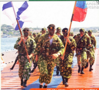
„პროსპა 2010“ - სახმელეთო ძალები

„აღმოსავლეთი-2010“-ს სამკოთა ხანაშიც პერიოდშიც არ გააჩნდა ანალოგი რუსეთის დასავლეთიდან აღმოსავლეთში გადასრდილი საბრძოლო ტექნიკით და ჯარების რაოდენობით ეს იყო ურთიულესი ამოცანა, თუკი გათვალისწინებთ უსამართლო მძიმეობას, სახელეო კოეზიციების სუსტად განვითარებულ ქველს (ურალის აღმოსავლეთით ერთადერთი მსხვილი საკომუნიკაციო ხაზი ტრანსკონტინენტური მაგისტრალი) და რუსეთის შსს ყველა დონის სამთავრო შეხვედრებისთვის ასეთი მასშტაბური სტრატეგიული გადასრდის უნარჩვევების უქონლობა.