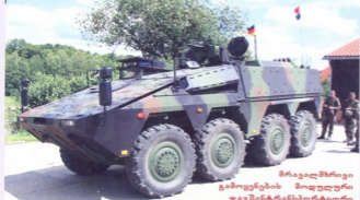
მრავალმხრივი გამოყენების მთავალი ჯავშანტრანსპორტიორი Boxer-ი

ცხ. ძალიანი, ხაჩარე — 80 კმ/სთ-ში, ხელის მარაგი — 600 კმ, შეიარაღება — 7,62 მმ-იანი და 12,7 მმ-იანი ტყვიამფრქვევები;