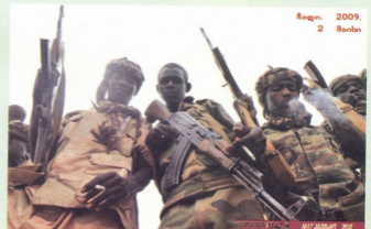
ჩადი. 2009. 2 მაისი