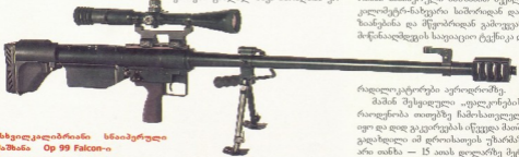
მსხვილკალიბრითი სნაიპერული შაშხანა Op 99 Falcon-ი

ეს იყო ჩხუპრი წარმოების 12,7 მმ კალიბრის სნაიპერული შაშხანა OP 99 Falcon-ი. დღეს, როდესაც ქართული არმიისა და სპეცსამსახურების არხენალშია არაერთი თანამედროვე მსხვილკალიბრითი სნაიპერული შაშხანა („ბარეტა“, „ანქისისი“ და სხვა), ძველად თუ ვინმეს გააკვირებს ორჯინიანი ჩხუპრი „ფალკონით“, მაგრამ ათი წლის წინ ეს ნიშანდია, რომ ქართველ სნაიპერებს ტრადიციული СВД-სგან განსხვავებით წერტილდენი სამიზნის და ზიანება 500-600 მ-ის ნაცვლად, უკვე 1500 მ-მდე შეუძლიათ ეს უიღ უპირატესობის იძლეოდა ანტისნაიპერული მიქმედების დროს. ამასთან, დიფრისიულ ჯგუფს ამ ჩხუპრი მსხვილკალიბრითი სნაიპერული შაშხანით შეეძლო კოლომეტრ-ნახევარი სიშორიდან დაეზინებინა და მწყობრიდან გამოეყვანა მიწინააღმდეგის საეიაციო ტექნიკა და