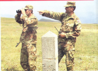
იარაღის ოთახის წესდების მიხედვით მონყობა სავაღე პირობებშიც აუცილებელია