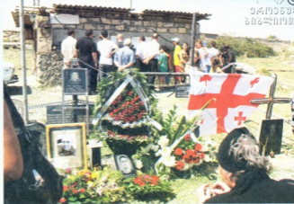
II ავტილნი ბრძოლის იდტილები ბერმა იდამიანმა მონიხებულა

შინდის სადგურის მდებარეობა რუსი ავტილნიების ჯერმანოვებისა ორი საათის