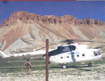
ქართულდროშიანი შვეულმფრენი ავღანეთის მიტეზში

დატვირთვის სახით 4000 კგ-ის გადატანა შეუძლია, მაგრამ ჩვენ მაქსიმალური დატვირთვით არ დაფრინავთ. მოგახსენებთ შვეულმფრენის საფრენოსნო შესაძლებლობები მნიშვნელოვნადაა დამოკიდებული ტემპერატურაზე, ასაფრენი წონისა და ტემპერატურის ღმირტეგებში ჩვენ ვეფლდეთის ვეფლებით. შვეულმფრენის სატვირთო-სატრანსპორტო ნაკვეთურში ჩატვირთული კემირგამამულობის ანტენები დამოდილი ვადავაკექს. ფრენის მარშრუტები წინასწარ იგეგმება, ერთ კვირით ადრე. ასე რომ, წინასწარ განსაზღვრულ რეისებს ვასრულებთ.