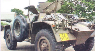
სადაზვერვო ჯეჟმანავტომობილი YP-104

ბრძოლებში გერმანელ პარამურტისტებს მკარე წინააღმდეგობა მე-2 ესკადრონის ჯეჟმანავტომობილებმა გაუწია.