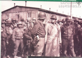
ჯორჯი არ იცილებდა თავის სახელგანთქმულ „კოლმპორ კოლტს“ Colt-45- Model-1873-Single-Action- Revolver-ს, რომელშიც არაერთი რთული სიტუაცი- ის დაძლევაში გაურჩა სამსახური... (ზედა ფოტოზე აშკარად ჩანს კოლტის ტარი)