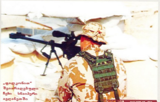
„ფალკონი“ შეიარაღებული ჩეხი სნაიპერი ივანეთში