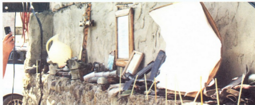
ბრძოლის შემდეგ მტროვილი ნივთები