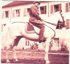
პატონმა საფრანგეთში საკავალდერისტო სკოლაში ისწავლა, ამერიკაში დაბ- რუნებულმა ჯერ სახელმძღვ- ანელო დაინერა და გამოსცა, შემდეგ კი შექმნა სახელ- განთქმული კავალერისტის ხმალი M1913, რომელიც მაშინვე მიიღეს შეიარაღებაში