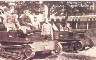
პოლანდიის არმიის ჯანვანტები Carden Loyd Mk VII

1927 წელს არმიამ „არნოს“ ორი მხებუკი ტანკი FT-17 შეიძინა და ისიც ხადემონსტრაციო-სასწავლო დანიშნულებით ერთ-ერთი სწავლების დროს „არნო“ რბილ ნადეგაში ჩაყვლი და ამ