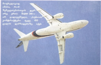
მიუხედავად იმისა, რომ შემკვეთებისთვის ჯერ არც ერთი Super Jet-ი არ გადაცემულა, „სუხოის“ კონტრაქტები უკვე 150 ცალის დემონსტრაციულად იქვს

ბრიტანულ ავიასალონზე რუსებმა ჩაიყენეს თეიანთი სამოქალაქო ავიაციის იმჯი — რეგიონული Superjet-ი, რომელიც ყოველდღე სადემონსტრაციო ფრენას ასრულებდა. ექსპერტებს თეიმფირინაჟის საფრენოსნო პროგრამა მანამდე, პარიზისა და მოსკოვის ავიასალონებზე პქონდათ ნახაზი და ამიტომაც რუსებმა ამით ვერაფერი გააკვირვეს. საინტერესო ის იყო, რომ თეიმფირინაჟის სერტიფიკირებისას მასი ექსპორტზე გატანის მეთაურობა საკითხი კვლავ წამოიჭრა, — ხალხისთვის ავიაკომპანია Pearl Aircraft Corporation-მა ერთდროულად 30 რუსული თეიმფირინაჟი იყიდა და ამიტომით 15 ღანინებზე წინასწარი ზღმუკრულება გააფორმა. რუსულმა „გაზრომეიამ“ 10 თეიმფირინაჟი შეიძინა. საერაულოდ, კიდევ 12 ცალს ავიაკომპანია Orient Thai Airlines-ს, მიიღებს, რომელიც ანაც წინასწარი ზღმუკრულება გააფორმა. ახლა „სუხოის“ 150 თეიმფირინაჟი აქვს შეკვეთა. 2029 წლამდე სულ 800 თეიმფირინაჟის აქეობა და გაყიდვა იგეგმება.