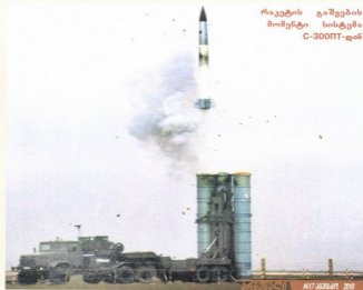
რაკეტის გაშვების მომენტის სისტემა C-300PT-დან

საზენიტო სისტემის ათვალხვას არკვალს“ გასაზრდელო, დღეობის შემადგენლობაში შეუყვანს დაბალ ხომალდეებზე მყერენი სამინხვების აღმოსაქინად