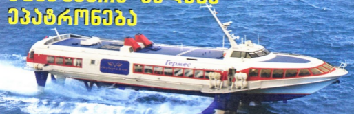
წყლქქეშა ფრთხიანი საზღვაო კატარლა Ekatere-ი

26-27 თელის სოხუბის კურესა და სოფელ ქველა ეურის სანაპირო ზოლის პირულად ჩატარდა რუსეთ-აფხაზეთის ერთობლივი საზღვაო სწვლედა „აქვი ზღვის უსაფრთხოება 2010“, საოკეანო ვარების სასაზღვაო საპატრულო კატარლების, შვი ზღვის ფლოტის საბრძოლო ხომალდისა და ე.წ. აფხაზეთის სამხედრო-საზღვაო ფლოტის სანაპირო დაცვის ძალების მონაწილეობით