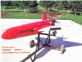
საავიაციო სისტემა Turna-1ს თვითმფრინავი-სამიზნე