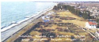
სანაბირო ზოლისა და რკინიგზის ხაზების დაცვა ერთობლივ მოვლითა ამოცანა იყო