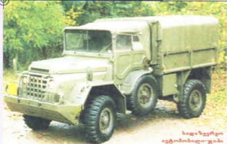
სადაზვერვო ავტომობილი-ჯიპი YA-126

1935 წლის თებერვალში რომი მოთვანი ბრახილის მოაერობამ იყიდა და ქალაქ სან-პაულოს პოლიციას გადასცა.