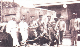
Royal Dutch Shell-ის დაჯავშნული ავტომობილი

1934 წელს ორი მათგანი გამო- საცვლელად ოსტინდლოფში გაიგზავნა, მაგრამ იქაური გზებისათვის დაჯავშნუ- ლი „კრუპი“ ძალიან მძიმე გამოდგა. საბოლოო საკუთარი ბენზინზე მომუშავე ძრავამაც შექმნა, ამიტომ მანქანები უკან, პოლანდიაში გაიგზავნა.