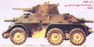
DAF-ის ჯავშანავტომობილი M39

გერმანოკური კრიზისი დაიწყო. ქვეყნის ქალაქები არეულობამ, გამოსვლებმა და დემონსტრაციებმა მოიცვა.