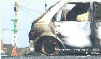
ბრძდილოეთ ირლანდია. 2009. 10 მარტი