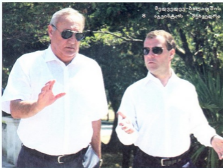
მედვედევი-ბაღდაძის 8 აგვისტოს შეხვედრა

ლი ძალების მართვის ორგანიზების მოქმედება და თვდაცვის დაგეგმვა“.