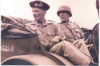
ჯერ კიდევ ხამერისკეკლავიანი პატრონი ფედელ-მარშალ ბერნარდ მონტკომერისთან ერთად

პრევი მსოფლიო იმის დამეურეუბის შემდეგ პატრონი რამდენიმე წინ ვეუბეუბეუბი ამის ემეინტეუბის მახეურეობდა. ამ პრეიბის მხ დიდე ჭეურეა მიაბრევი სატანკო ნაწილებს პრობეუბინადას, რადეუბი დრეიდ სწედა, რომ შემეუბი იმეუბის მათი ვეუბეუბეუბეუბი როლი მტევიმეუბეუბი, მაგრამ მსოფლიო ვეუბეუბეუბის მამხრეობა მიაბრევი. შტატების პოლეტიკოსთა და სამხედრო ხელისუფლების უმეტესობის ვეუბეუბეუბი უფრო ვეუბეუბისა და ფოლტის ვეუბეუბეუბის ლეიბს წლევი ამ მამხრეუბეუბი მიღევი-