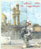
ერაყი. 2010. 25 ოქტომბერი