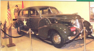
დღეს გერმალ პატრონი აღდგენილი კოდლიაკი სამუზეუმი ექსპონატია (ზედა ფოტო). მარცხენა ფოტოზე — იგივე კოდლიაკი 1945 წლის 9 თვეების შემდეგ.