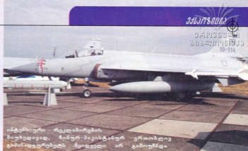
ინტენიური რეკლამირების მიუხედავად, ჩინურ-მაკინტაშურ ერთობლივ ტამინადგურებებს მყიდველი არ გამოუჩნდა

ავიაკომპანია Germania-მ ხვითი A319 შეიძინა. მართალია, გარიგების ღირებულება „მხოლოდ“ 372 მილიონი დოლარია, მაგრამ ინტერესს სხვა გარემოება იწვევს, — ავიაკომპანია მანამდე მხოლოდ „ბონგის“ თეიმფირინაჟებს ეფუძნებოდა. გაიყიდა არაერთი შეღარებით პატარა თეიმფირინაჟიც. ბრიტანულმა ავიაკომპანია Flybe-მ 5 მილიარდ დოლარად ბრახილური ფირმა „ფმბრაერს“ 140 რეგისტრირებული თეიმფირინაჟი შეიძინა. განზე არც რუსული კომპანიები დარჩნულან, — „აეროფლოტმა“ 11 A330-ზე გააკეთა შეკვეთა.