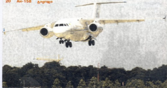
წლებანდელ ავიასალონზე თეიომფრინავის დებიუტთან ერთად, ანტონოვმა 20 An-158 გაყიდა

ევროპულ კონცერნს ავიასალონზე სხვა მიღწევებიც ჰქონდა. გერმინულმა