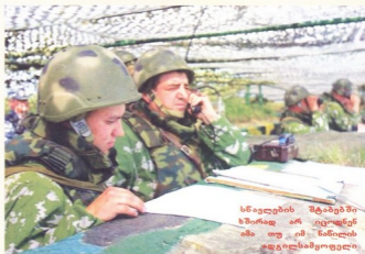
სწავლების შტაბებში სპირად არ იცოდნენ ამა თუ იმ წინილის ადგილისამყოფადი

ჩანაფიქრითა და ხელმძღვანელობით“. „აღმოსავლეთი-2010“ სტრატეგიული სწავლება რომ ყოფილიყო, უნდა ჩატარებულყო ერთიანი გეგმით და გაერთიანებისა რამდინემე ოპერატივა საერთო ჩანაფიქრითა და ხელმძღვანელობით ის, რაც