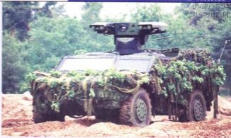
მსუბუქი სადაზვერვო ჯავშანავტომობილი Fennek-ი

პოლანდიის არმია ზერეულ აბოქსიორებს 1 2011 წლის დასაწყისიდან მი-