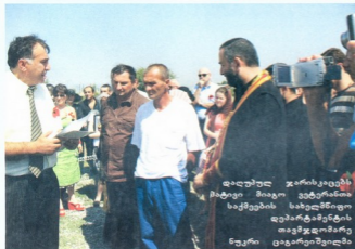
დადუშულ უკრაინელების მატევი მიათო ვეტერანიო საქმეების სახელმწიფო დეპარტამენტიის თემჯდომარე ნუკრი ცატარევილი

განმელოლაში წინსვლას ვეღარ ახერხებდა და ბოლოს დასახმარებლად ვიაციკა გემოსახა.