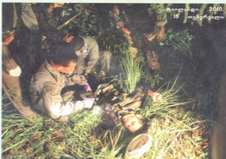
ტაილანდი. 2010. 15 თებერვალი

21-ე საუკუნის მსოფლიო რუკაზე 33 მეტ-ნაკლებად ცხელ წერტილს ითვლიან. ოში მძვინვარებს მთელი თავისი სისასტიკით, სხვადასხვა ქვეყნების სააგენტოების საუკეთესო ფოტოკორესპონდენტები კი თავიანთ საქმეს ბრძოლის ველზე ჩვეული სიმშვიდით, პროფესიონალურად ასრულებენ, რათა ცეცხლის, სისხლის-ღვრის, ცრემლისა და ტკივილის ჩვენთვის გადმოცემა და გაზიარება, მთელი თავისი სიტყვადით შეძლონ.