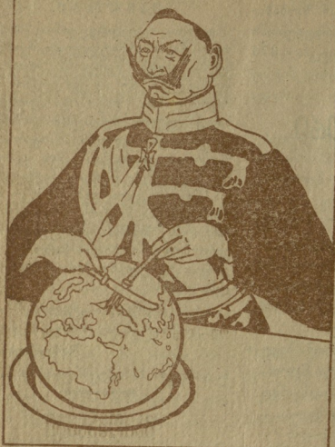
ვატვი ხილვი ა' თუ ძეკახე არ ვამოგა