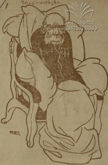
მე ხომ მავლივარ სიცილის ზემს სამეფოსაჲ თან ჩავიყოქმ.