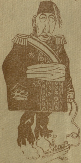
ლხმარქოს სუტთახი მავლ. V.