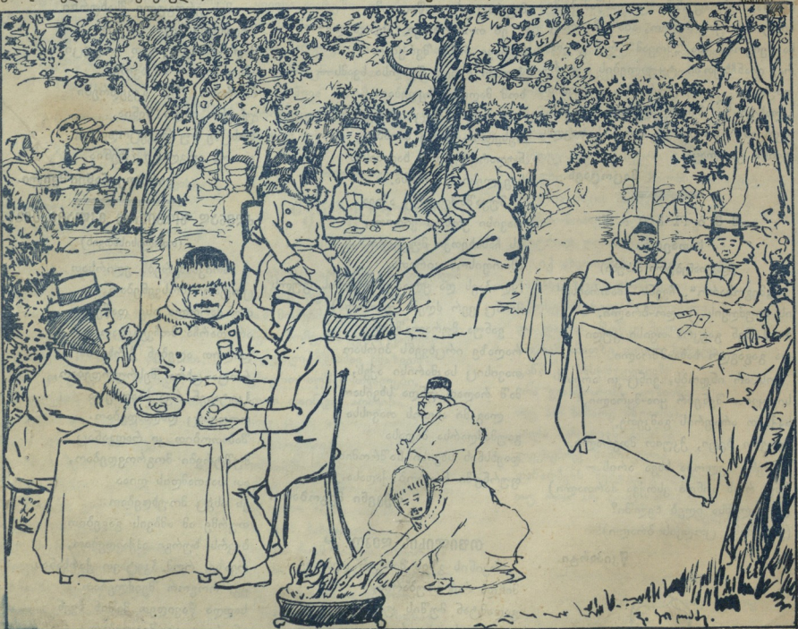
თფილისის ქალები - სახაფხულო ბაღებში.

საყრდელი კაცი ყოფილხართ ბ-ნო ვასილ გიორგიის თქვენ მე მიწვეეთ სამედიცინო ნამართლში რა საბუთების ძალით? თუ სხვის აბეჭუბობას ეწვეო (მგონი ვერ შესაბულო, მზიმე რალი ვიცითრბით) ვერ დაზისახელო ის პირნი ვინც დაგვანდა თქვენ ეს რალი და შერამე შხათა ვარ გამოგვეც საშედატროთ სულში.