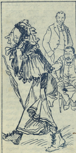
ქ რაფა ქვიციანი?