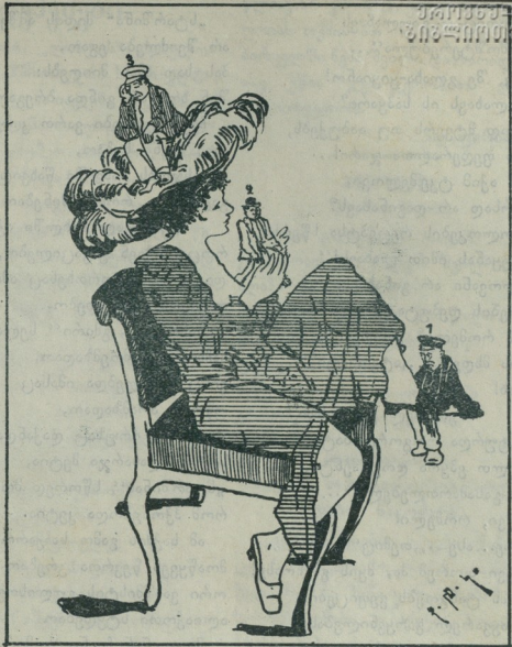
1) მუშტაში ვარ. 2) გოლაგინსკზე დაღვივარი. 3) ფუნჯულტრზედ აველი.

ხორა: დახე ქალაქის ბედსა სულ დანაგრევს ის მთებსა