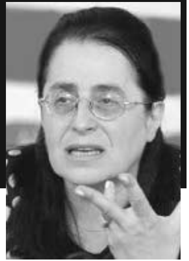
ბის მკვლელობის ფაქტს გულისხმობთ?

– არა მართო, მაგრამ თუნდაც ეს ფაქტი იყოს. სასწავლო პროცესის დროს მოხდა სასტიკი დანაშაული. კი არ მოკლეს, დაკლეს ბავშვები და სკოლის დირექციას პასუხი არ უგია.. რატომ არავინ დაინტერესდა, დანაშაულის ჩადენის დროს, სად იყვნენ 51-ე და პირველი ექსპერიმენტული სკოლის დირექტორები? თუ ადგილზე იყვნენ, რა გააკეთეს, რომ ეს არ მომხდარიყო? მე თუ მკითხავთ, მართო დირექტორები კი არა, სამინისტროს მთელი შემადგენლობა უნდა გაეშვათ. სანამ თანამდებობა მართო მაღალ ხელფასთან ასოცირდება და არა პასუხისმგებლობასთან, ვერც ივანიშვილის დაბრუნება გვიშველის და ვერაფერი. დღეს არასრულწლოვანთა დანაშაულის ზრდა ყველაზე დიდი გამოწვევაა, ამიტომ არათუ თანამდებობა უნდა დატოვებინონ, პასუხი უნდა აგებინონ ყველას, ვისი ბრალეულობაც ამ საქმეში იკვეთება.