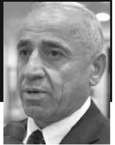
ლევინ და თუ რამე დაეძვრებოდა, გამოსადიებელი არაფერი იყოს.

სააკაშვილის ბანდიტები არა მარტო მაიდანზე ხვრეტდნენ უდანაშაულო ადამიანებს, არამედ მათ მონანილეობა მიიღეს ოდესის „ოპერაციაში“, სადაც მომიტინგეები შენობაში შერეკეს და ცოცხლად დანვეს