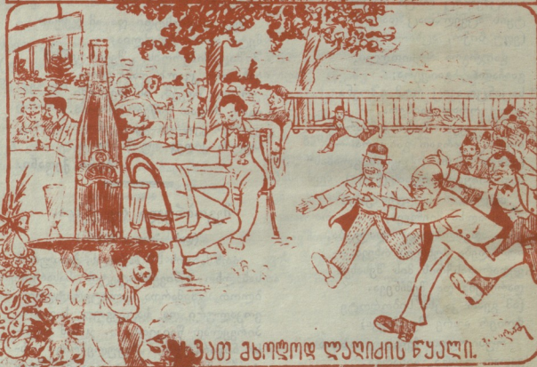
მათ ახოლოდ ლადიძის წყალი.