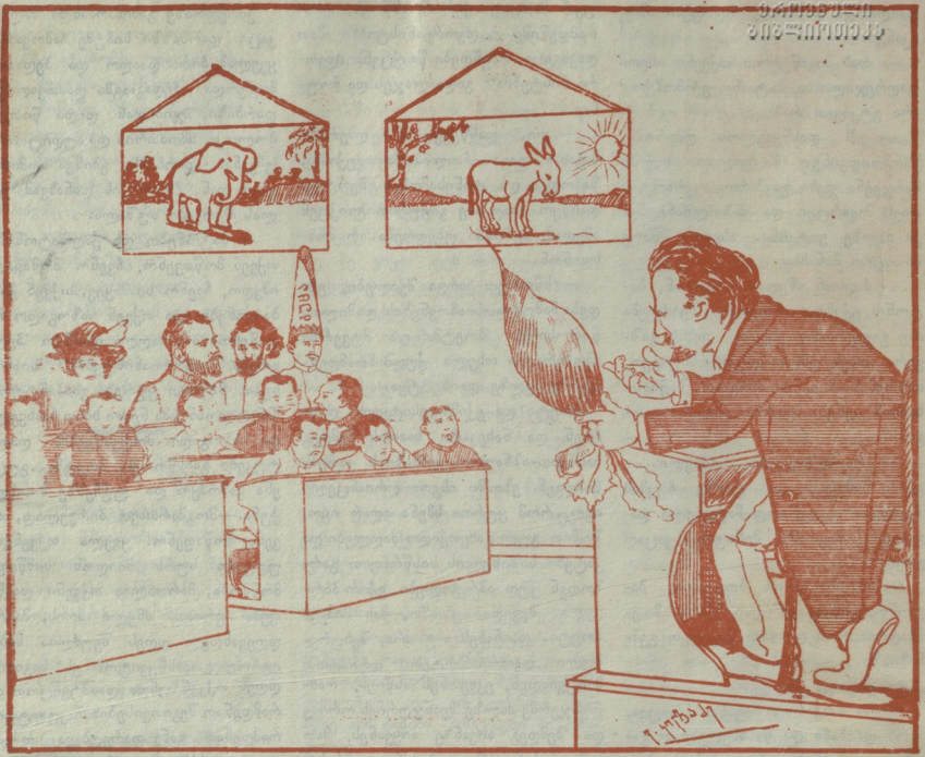
„ბოლოკისტი“ მასწავლებელი უხსნის „დვორიანისტებს“ ბოლოკის მნიშვნელობას.

და გაითვალისწინოთ მისი დღევანდელი მნიშვნელობა, დარწმუნდებით რომ ამ ბოლოკს დიდი ისტორიული მნიშვნელობა აქვს. დღეიდან, უკეთუ ჩვენ ეს ბოლოკი კარგად მოვხზა-რეთ და მიზანს არ ავაქვინებთ, რაიცა უმთავრესად დამოკიდებულია თქვენზე, ახალგაზღვრებზე—პედაგოგმა „დვორიანისტებისკენ“ დაახრევიანათაი ბოლოკს—ბოლოკს ჩვენ ისტორიაში პირველი ადგილი ეკირება. მე აქ თქვენ ყურებს არ მოვალაღვ იმას განმარტებით თუ როგორ ითესება და იზრდება ბოლოკი. ყველა თქვენგანმა იცის, რომ მას სთესავენ გაზაფხულზე. ის ამოდის, როგორც საზოგადოთ ყოველი მცენარე თუ რაიმე ცხოველმა უდროით არ მოწიწება, ჩაქარა იზრდება, ბოლოკს