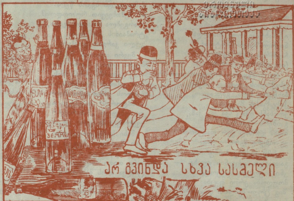
არ გვინდა სხვა სსსკელი