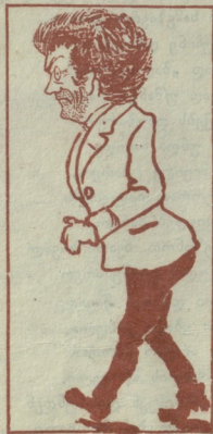
უფროსის წინ სდგას წელში მოხრილი, საქმეში ფრთხილი და გამოქნილი..

კი არ გგეონოსთ აქ დიდი რამე: სისულელით სჭირს ვგ სითამამე!..