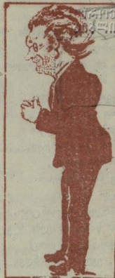
ჩვეულებრივ დ ბუზგალტერია: არცა ქვეიანი, არც მთლად შტერია...