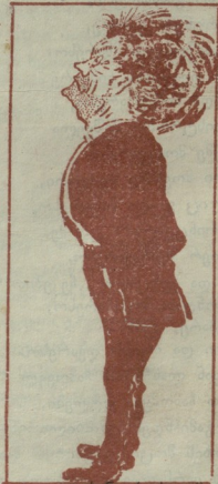
და ხახ, როს ვაგვის როლშია მდგომი, ის იბღივრება, ვითარცა ლომი.

კი არ გგეონოსთ აქ დიდი რამე: სისულელით სჭირს ვგ სითამამე!..