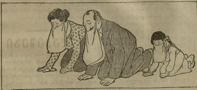
3 — ხუთშაბათი. ქატო ქმრით.