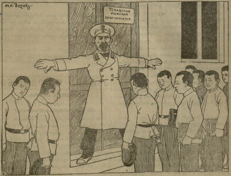
— რა საქირა თელავში მეშვიდე კლასი? ანაბანა ხომ ისწავლეთ და გეყოთ... ახლა თავისუფალი ხართ, გასეირნეთ საითაც მოგებალისოთ.