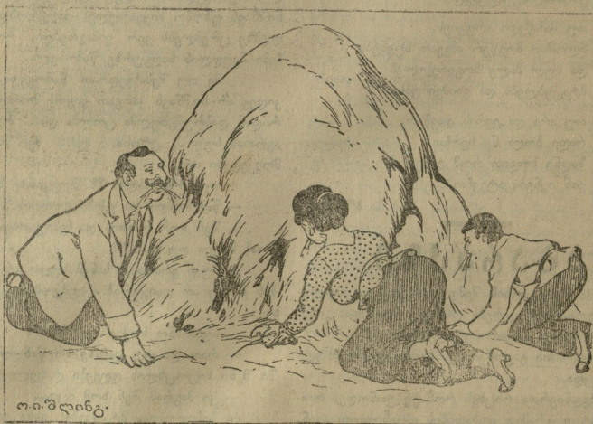
ო. ი. შლინტი.