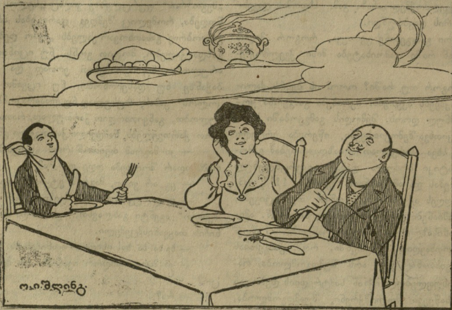
4 - პარანასევი. ეს ღლე შეიძლება ოცნებაში გავატაროთ, ხვალ ხომ სახსნილო გვექნება!!