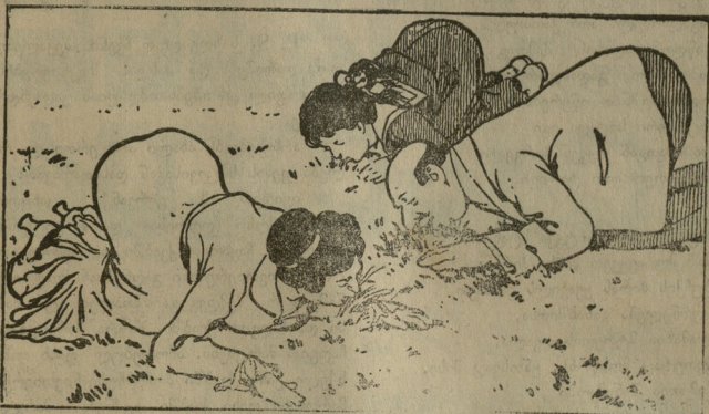
2 — ოთხშაბათი. ნეღლი ბალახი.