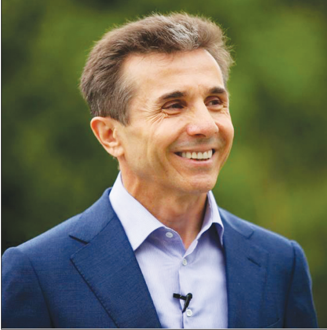
ყოფილი პრემიერ-მინისტრი ბიძინა ივანიშვილი დათანხმდა, რომ პარტია „ქართული ოცნება“ დემოკრატიულ საქართველოს უხელმძღვანელოს. ამის შესახებ 26 აპრილს

გამართულ ბრიფინგზე საქართველოს პრემიერმა და პარტიის ამჟამინდელმა ლიდერმა გიორგი კვიციანიშვილმა განაცხადა.