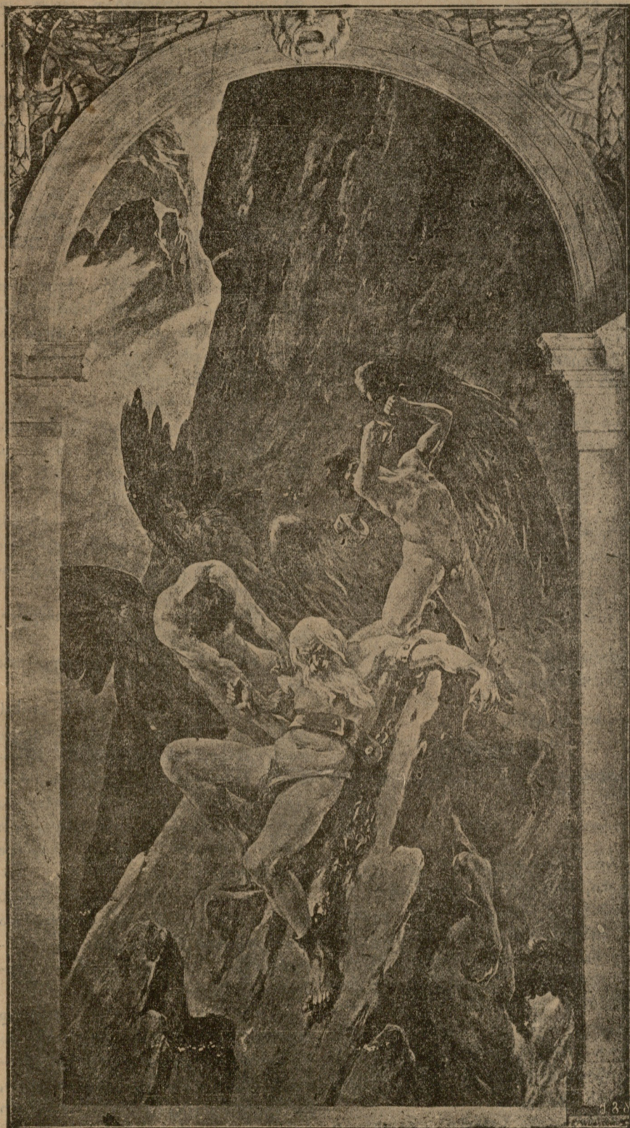
ქველ ღმერთების ღამხობა. ნახატი ჰერმან პრელისა.

3 საქართველოს დემოკრატიული რევოლუციური პარტია