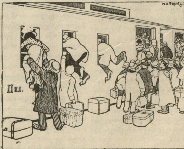
თბილისის რკ. გზის სადგურზე.