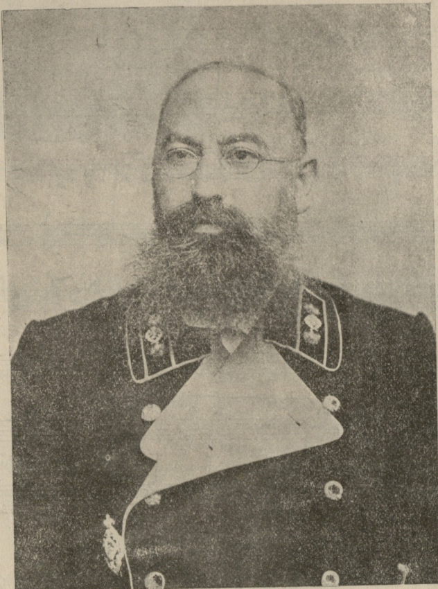
† თევდორე დავითის ძე ჟორდანი. დაიბადა 1854 წ. აპრილის 20, გარდაიცვალა 1916 წლის დეკემბრის 22). (იხ. „საქართველოს“ დღევანდელი №).