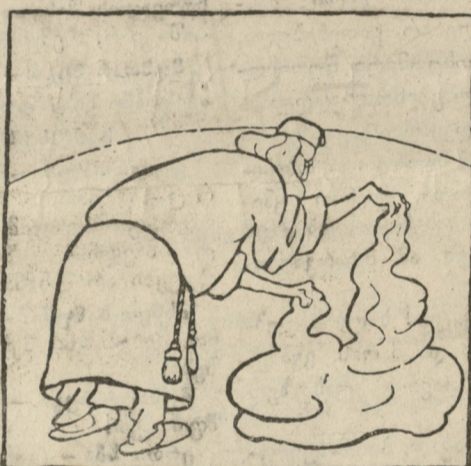
„აჰა, შესაფერი ტალახიც“.