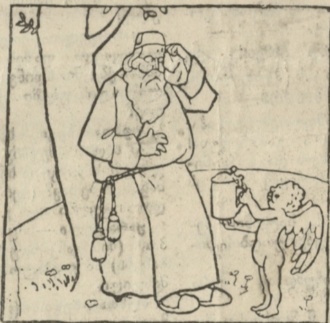
„ქვეყნის გაჩენა ჰევრი ოფლი დამიჯდა. ახლა კი უნდა დავისვენო: მოდი თედორე ღლონტს გავაკეთებ!“