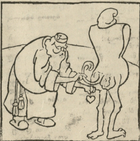
„კინალამ კუდი არ დამავიწყდა! ეს ხომ ყმაწვილს საჭიციანოთ დასჭირდება. ბარემ გულსაც ზედ დავკიდებ, რომ ამ თავითვე შარვალ ქვეშ ჰქონდეს“.

ოლიმპიელმა ღმერთმა მკითხველის გონება-მახვილობაზე მიაგდო იმის გამოცნობა, თუ რის თავი აბია ბ. თედორე ღლონტს?