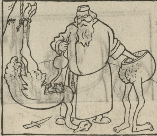
„მუცელი დიდი უნდა გავუჭოთო, კუჭი კი სირაქლეშის მივსცე, რათა ყველაფრის მონელება შეეძლოს“.