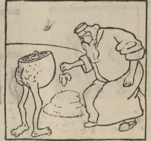
„ლეღვის ფოთოლი სადგურ ლანჩხუთიდან გამომიგზავნეს“.