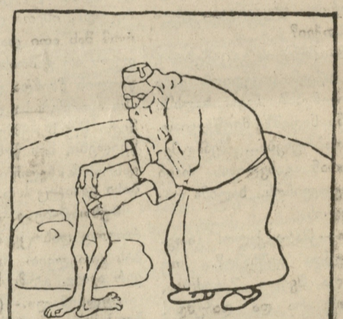
„დავიწყებ ფეხებიდან. ერთი მიაბიჯებს წინ, მეორე მიაბიჯებს უკან“.