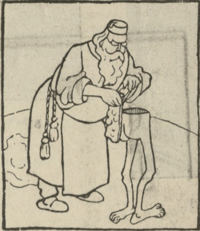
„შემდეგ ტორსო. უკან სქელ ტყავს მივაშაგრებ, რომ ზოგიერთ პანტურებს გაუძლოს“.

უფრო ლმობიერი იყო „ზვირთი“ „თანამედროვე აზრისა“ თანამშრომლებისადმი: „ჩვენს ბრძოლას მათთან მეტი დეენტლმენობა ახასიათებს, მეტი პრინციპიალობა და სიღინჯე“. ამ ციტატების სავსებით შე'აგნებათ საჭიროა გავიხსენოთ თუ როგორ გააჩინა ოლიმპიელმა ძევსმა უებრო ჯენტლმენი ბ. თედორე ღლონტი.