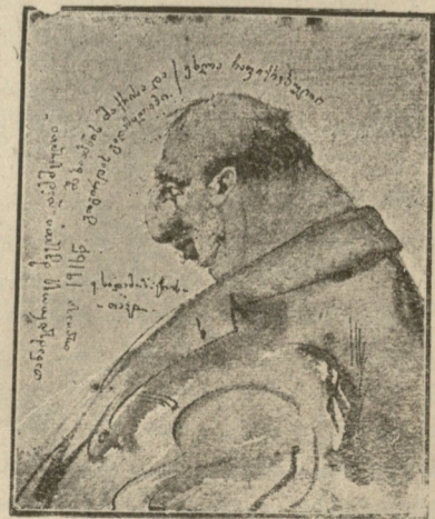
ჩვენი დროის რანდი.