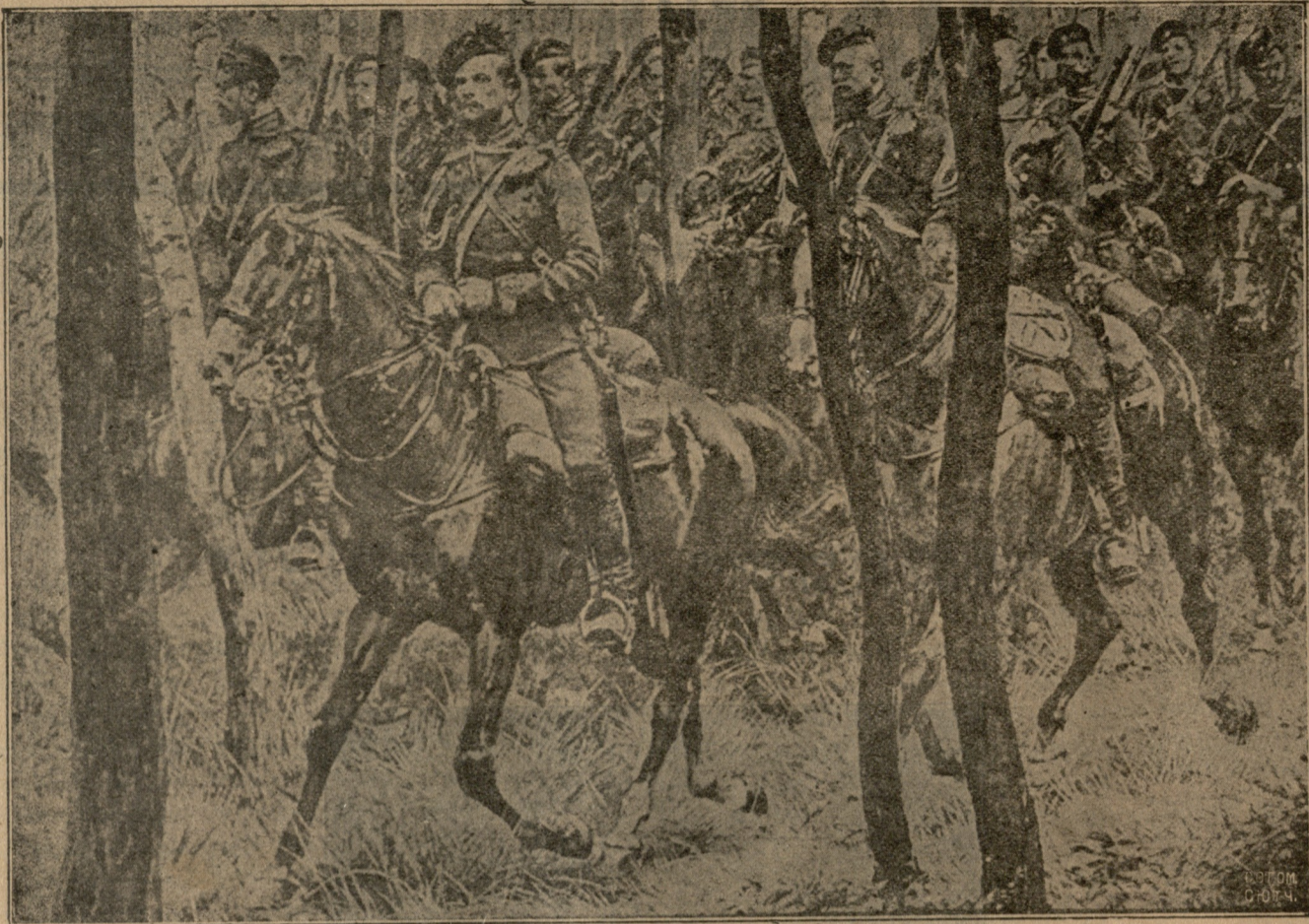
ბელგიის საზღვარს გადადიან.