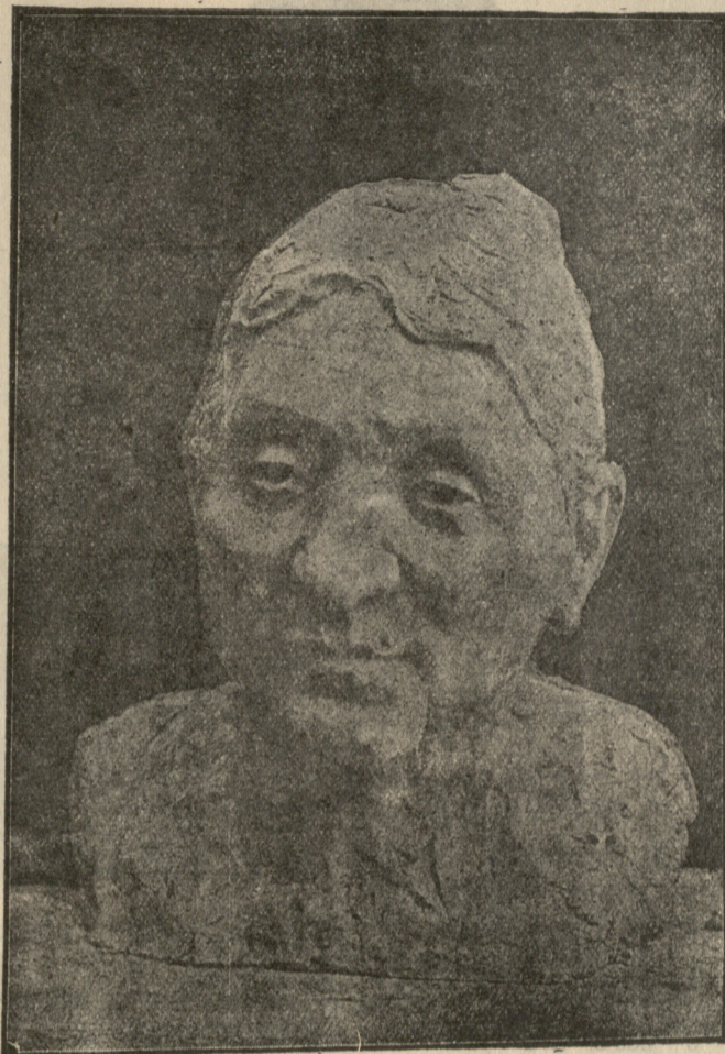
ანახტასია თუმანიშვილი-წერეთლისა. ქანდაკება მ. კიაურელისა.