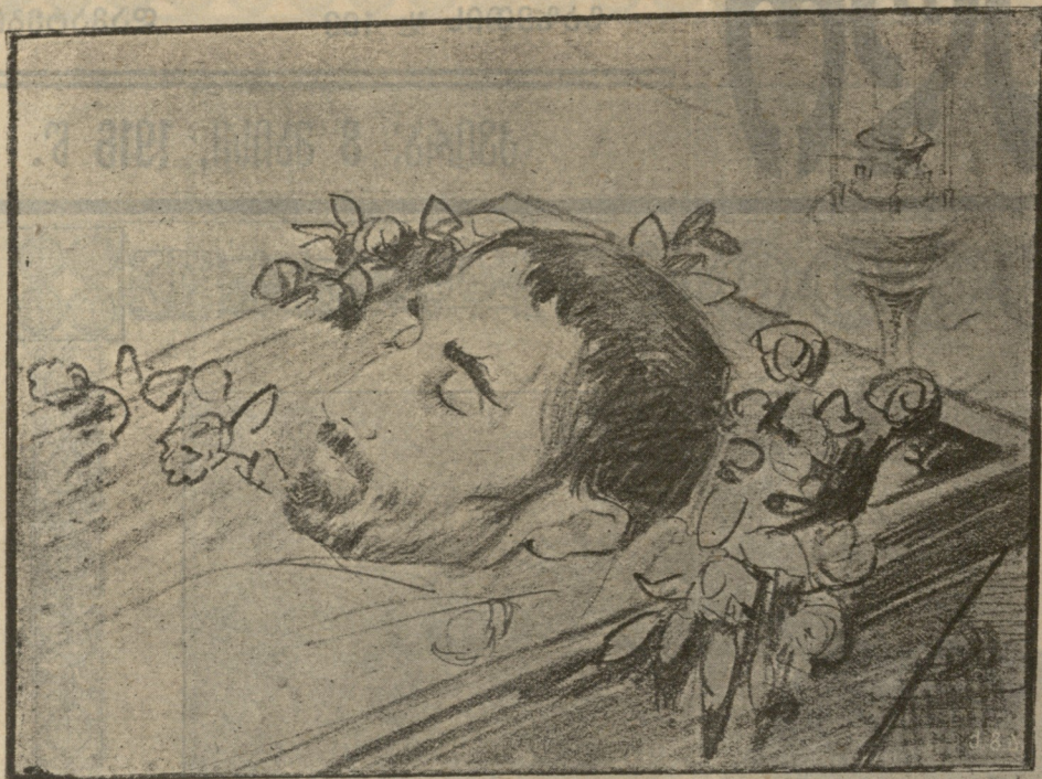
ირ. ევლოშვილი კუბოში. (ს. ერისთავის ნახატი).