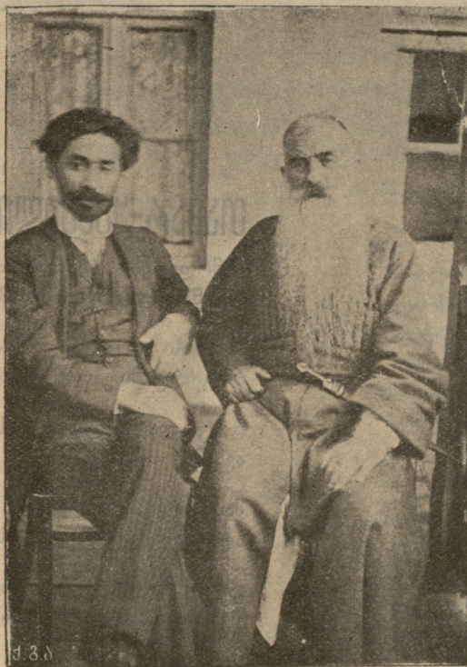
ევლოშვილი და რუს-იმერელი.