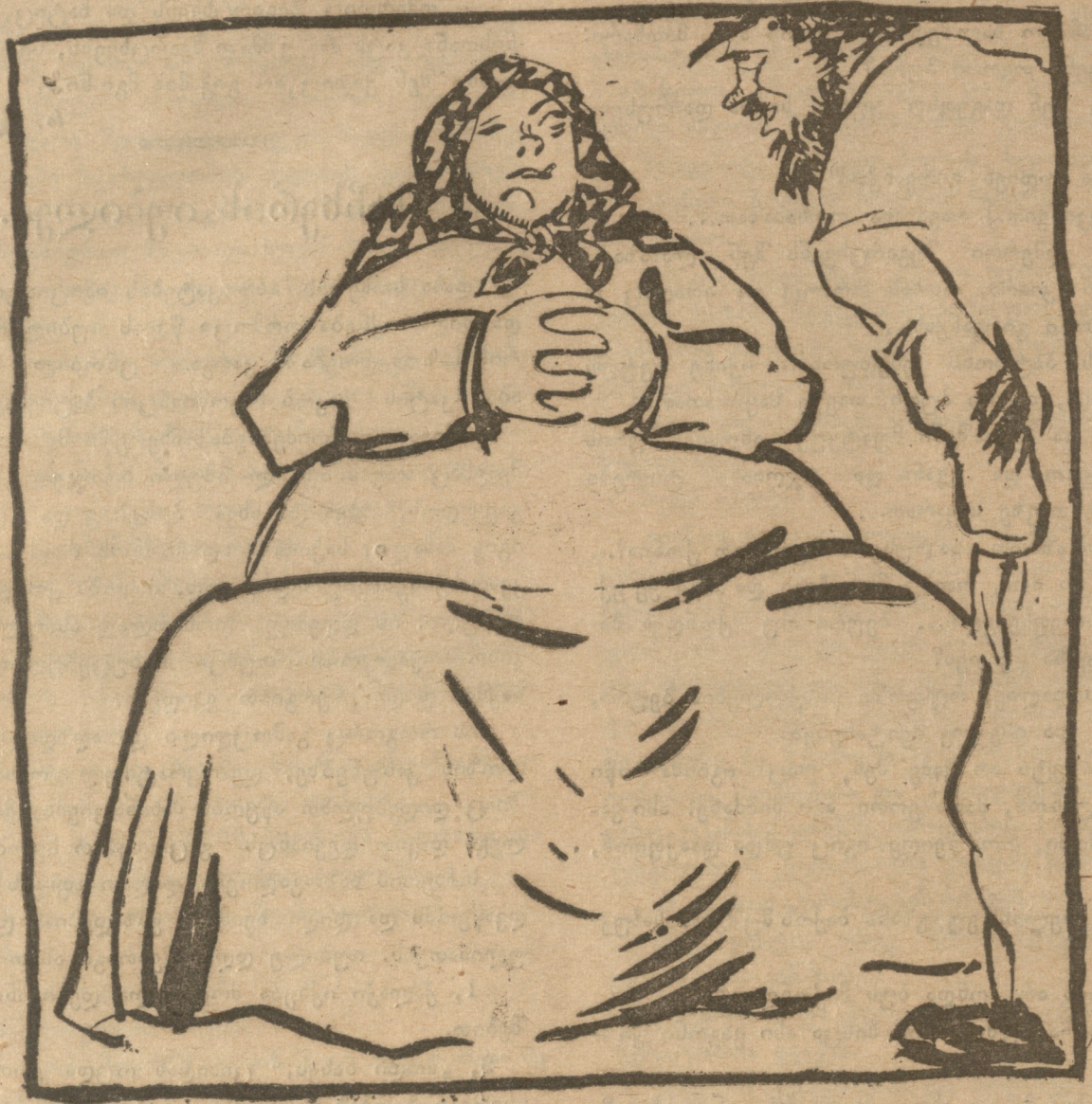
საბჭოთა რუსეთის „მალაზია“ წინიდან.*