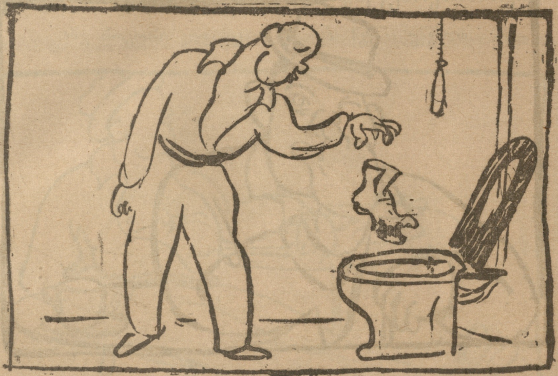
დაგლეჯილი ჩეჭმების უალოგო ალავას ჩაგდება.