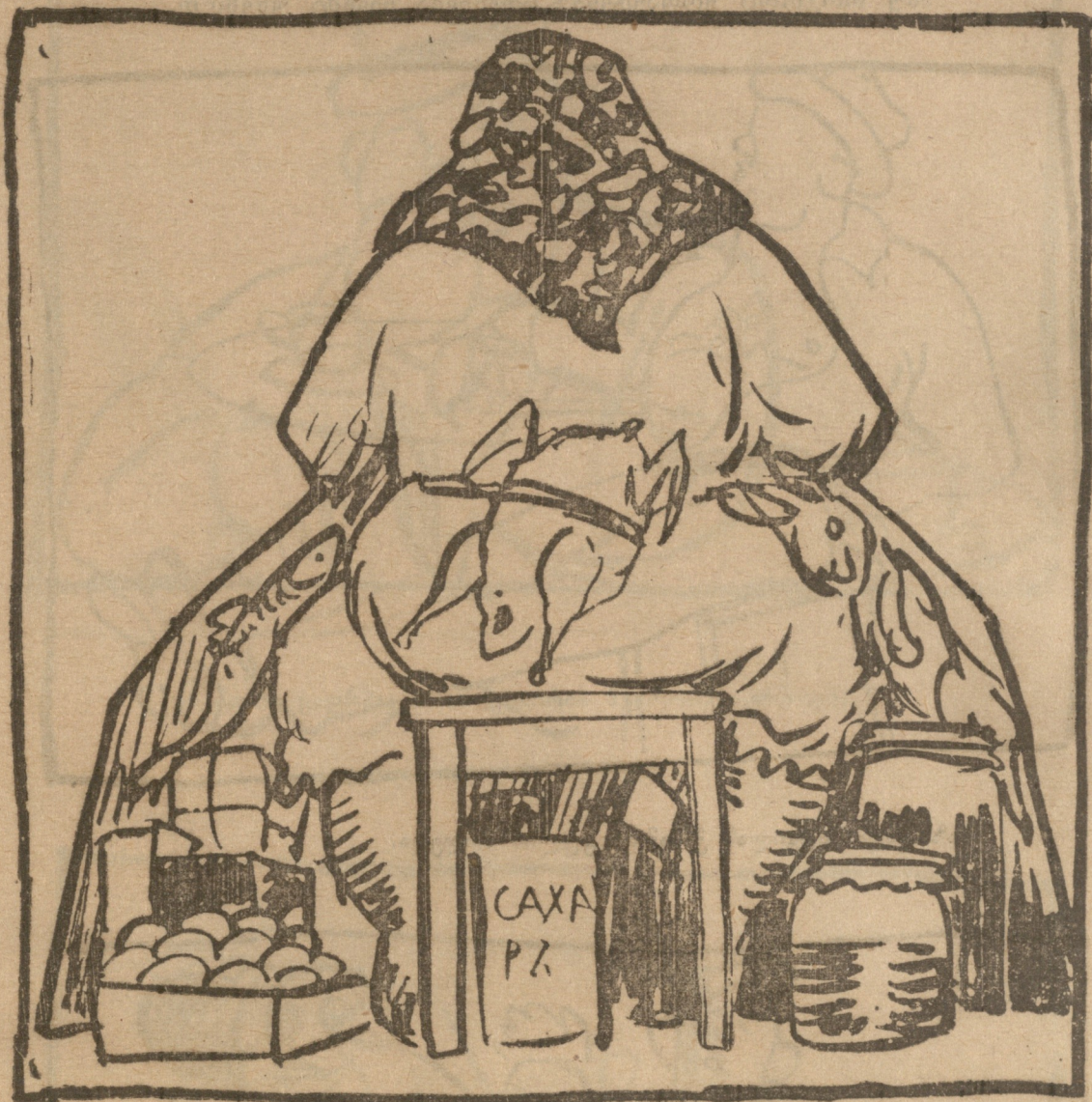
იგივე „მაღაზია“ უკანიდან.

მარა ეს კიდევ არ ნიშნავს ქურდობის პატიებასა და გეკითხები, ვით მსაჯულს, თუ მომცემთ ამის ნებასა.