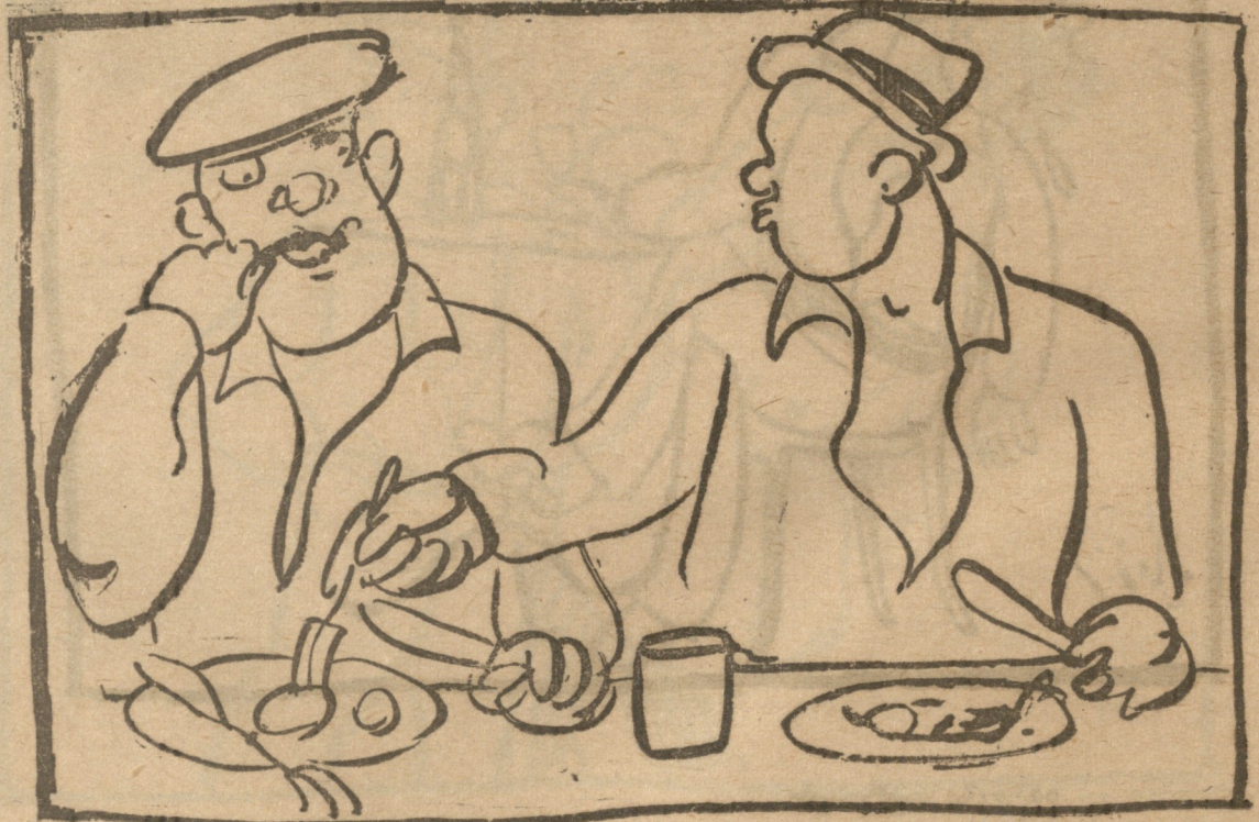
სხვისი თვფშიდან ლუკმის აღება.