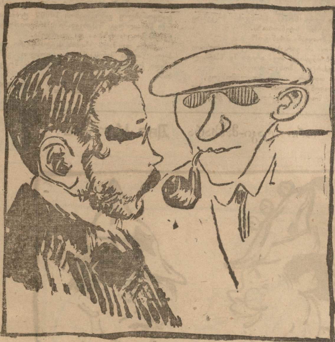
კამენევი და რადევი.

აზიური ხასიათი. უნდა დავამზადოთ მოსკოვისათვის ერთი თვის საკვები ფლავი. მოგეხსენებათ მოსკოვი, როგორც სოციალიზმის სამეფო, ბრინჯს და სხვა ამის მსგავს აზიურ საჭმელებს მოკლებულია. ამიტომ დავადგინეთ მოგვეცეთ თქვენ ათი ათასი ტომარა ბრინჯი; ნარბოზი დარწმუნებულია რომ თქვენ, როგორც ლიდერი საბჭოთა სპარსეთისა დააკმაყოფილებთ მის თხოვნას.