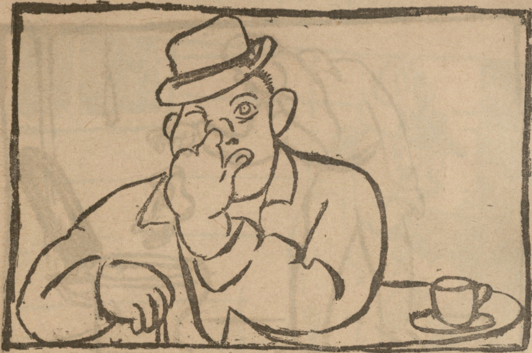
საკითხის გაღრმავებისას ცხვირის წესტოს გაღრმავება.