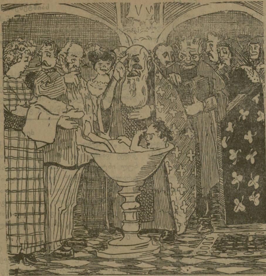
წმინდა ნათლისღება სოლომონ ზურგიელიძისა.