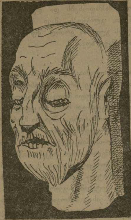
ნილაბი სოლომონისა.