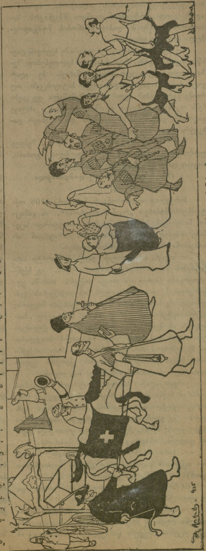
სოლომონ ზურგიელიძის დაკრძალვა: დიდებული სანახაობა.