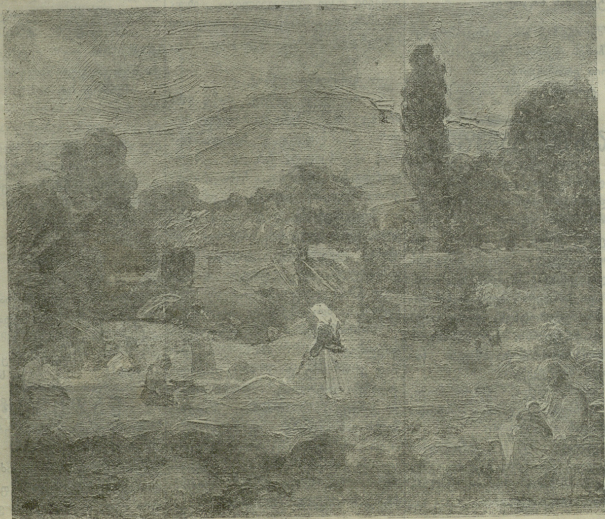
კალაოკა სოფლად, — ნახატი კ. ქავთარაძისა.