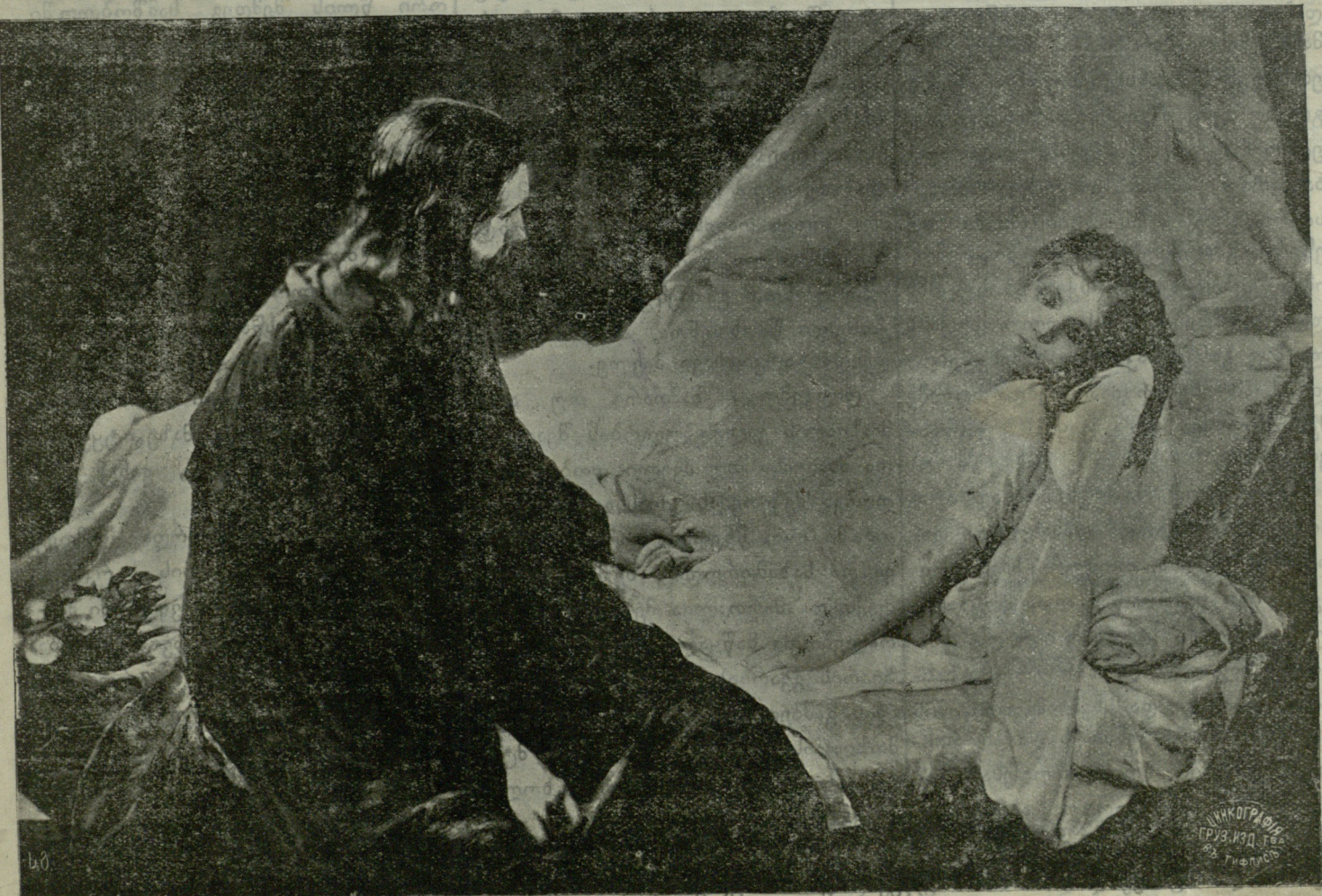
ქრისტე ავაღმუფთან - ნახატი კრამსკისა.

№ 13 კვირა, 1 ივნისი. ერთი წლით ჟურნალი ღირს 2 მ. 50 კ., ნახევარი წლით 1 მ. 25 კ. წერილები და ფული უნდა გამოგზავნოს შემდეგის ადრესით: გიფლსხ. Мухранская 12, для журнала „ЛАХТИ“. ფასი 5 კპ. № 13