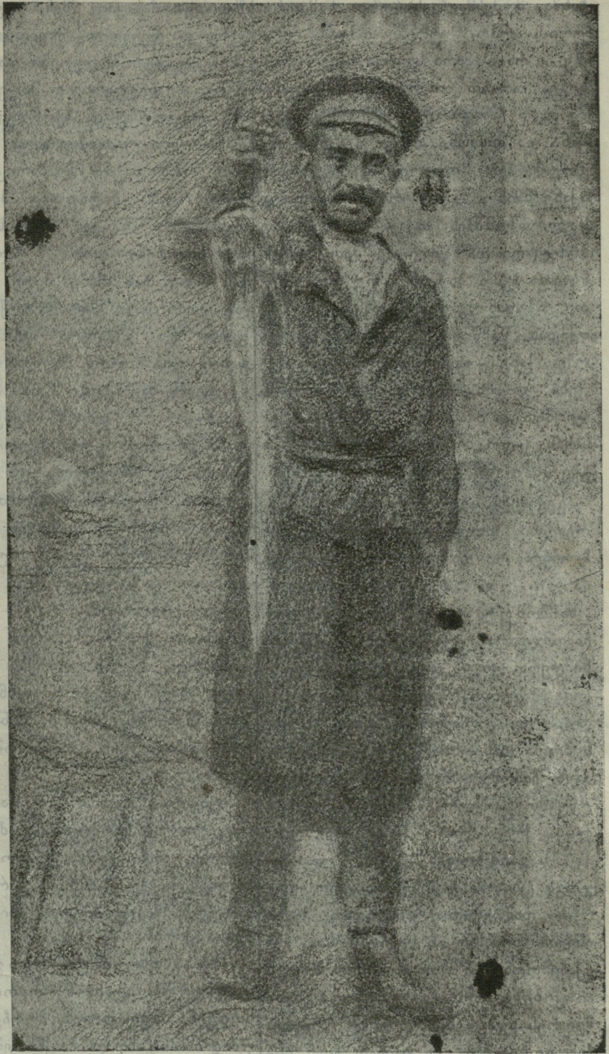
თავით მოგახარა. — ნახატი კ. ქავთარაძისა.

გევიხედე ერთი ჩვენებური გამო წყობილი კაცი ქე შოდის ვინცხა. „გამარჯობა შენი ძამია თქვა“. „გაგიმარჯოს ღმერთმან ჩემო ბატო- ნიო.“ „მეგრელი ხარ შენ ძამია მეთქი?“ „დიხ მეგრელი ვარო“. „სეით მიდიხარ მერე ასთე გაჩქარე- ბული თქვა?“ „აგერ თერთ სახლებ- ში ლექციას კითხულობენ უფასო- და, იქინე მივდივარო.“ მე ვიფიქრე ეგებ იქინე ვნახო ჩვენი ბიჭები თქვა. დეიცა ძამია, მეც წამოვალ თქვა და წვევდით. შევედით შით, ერთი პატიოსანი კაცი ჟდანა და ლაპარიკობს, მარა რას ლაპარი- კობს. უკეთეს ლაპარაკს გეიგონებ თუ? არ შეგქამოს ქირმა. მოყოლია თლა ჩვენი მუშების თავ-გადასავალს, და მოსთქვამდა: მუშებმა ასთე უნდა