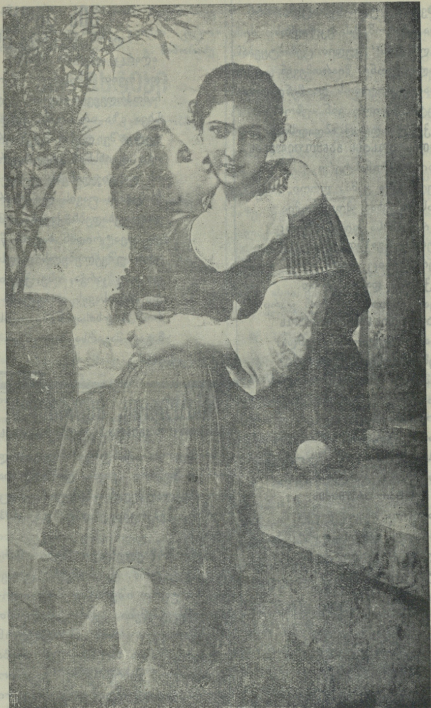
ღ ა ხ ბ ი.

10) დავაარსოთ სხვა და სხვა ქა- ლთა საზოგადოებები, ამოვირჩიოთ კომისიები, დავეოთ ფუნქციებათ, რომელთა უმთავრესი მოვალეობა იქნება: ახალი მოდების განვითა- რება, „ღამაშნი ვერების“ გამარ- თვა, თმების ხელოვნურად დახუჭუ- ქების მოწყობა-შესწავლა და სხვა.