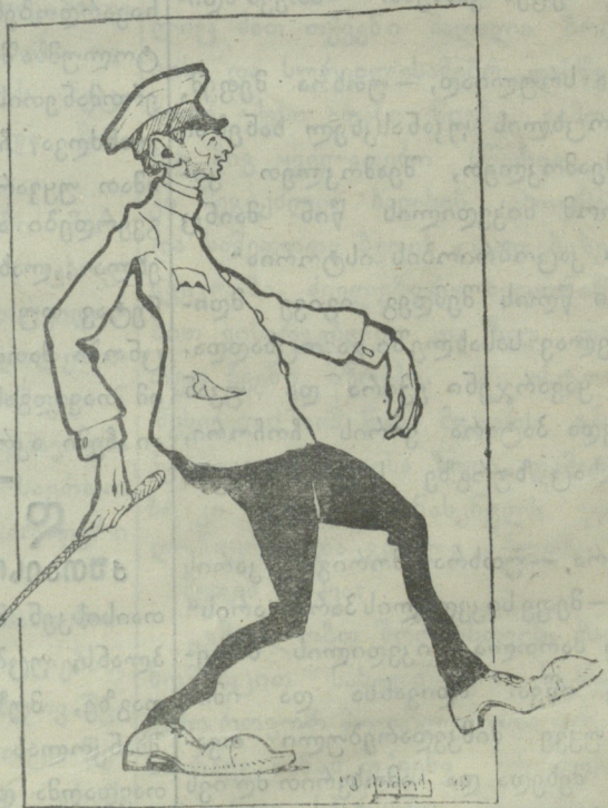
ქართველი ლარიზი სტუდენტი. ვიმნაზია გავათავე ვაითა და ვაგლახითა, ბულვარზე დავბტი, ვცუნცრუკებ ბარიშნებთან მათრახითა. უნივერსტეტს ვინ მალირსებს ფრთა გავშალო ცოდნაშია, ყილი რომ მომბებრდება მწერლოთ შევალ ფოსტაშია!..