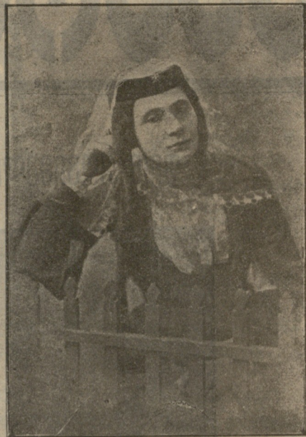
† ევგენია ივანესასული კოტიევისა. (იხ. „საქ.“ № 172).