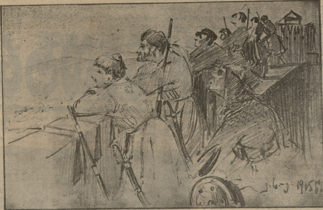
ბრძოლის მოლოდინში ძველად.