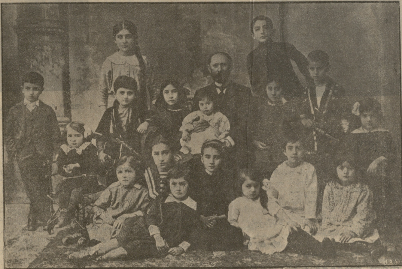
შიო მღვიმელი ბავშვებთან.

შიო მღვიმელის სამწარმო ასპარაჟი 30 წლის უახლესების გამო