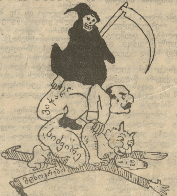
სიძვირემ და გაქირვებამ მკვიდრ მეზობრებსა უყო ჭიჭი, შეებრძოლა, ხრიკი უგდო, წამოელღართა და გაჰყლიტა!