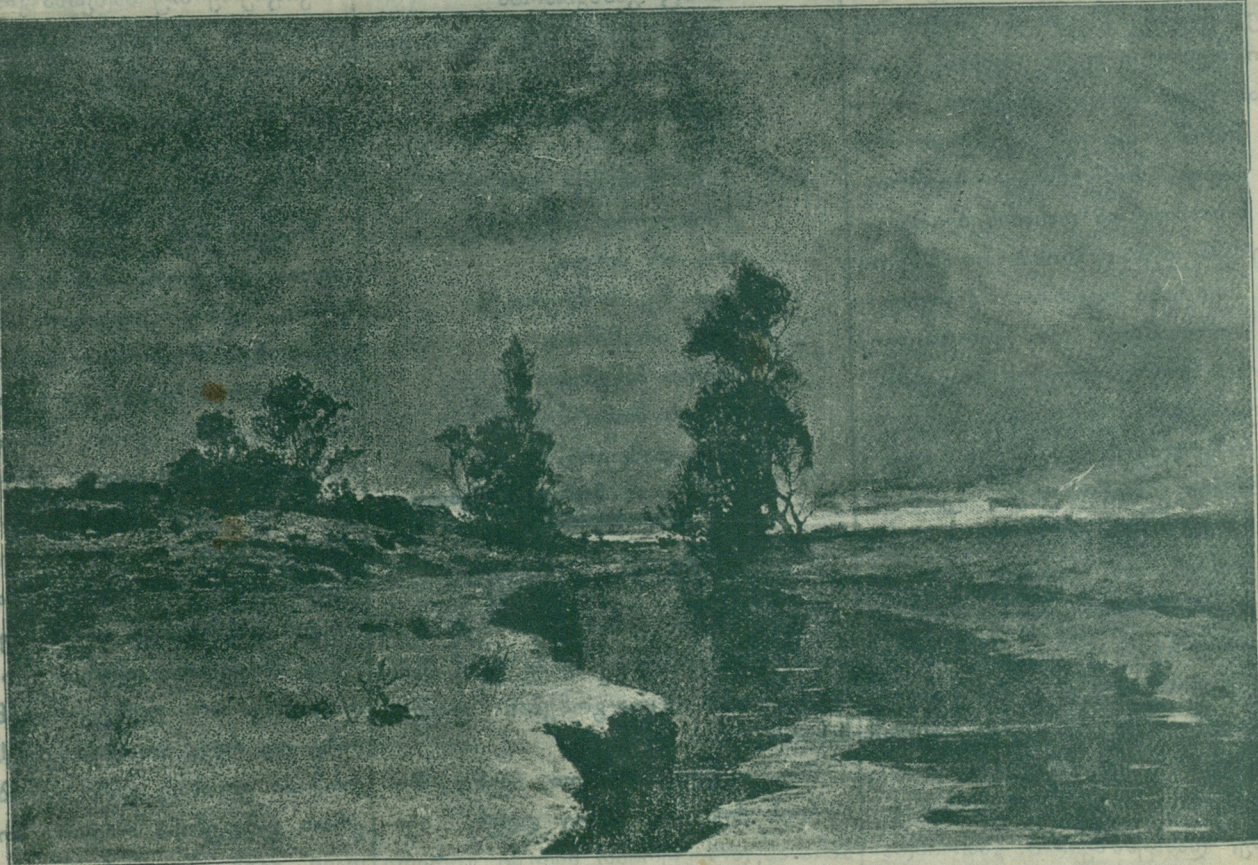
გ ა ვ ა ვ ხ უ ლ ი — სურათი ენდოგუროვისა.