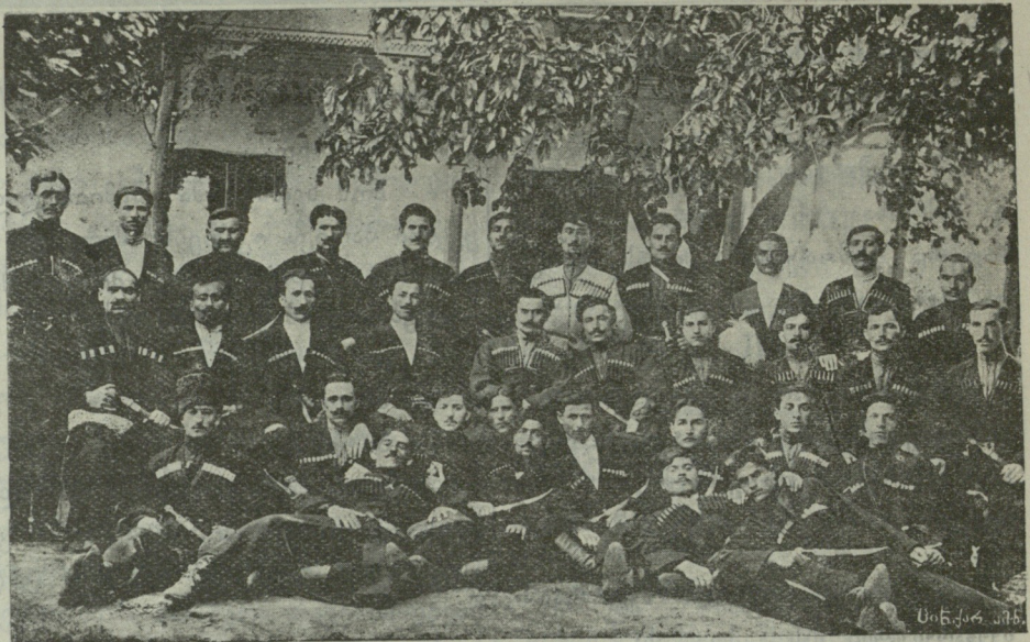
ტფ. ქართ. მუშათა მომდგრად-მგალობელთა გუნდი. დაარსებული მ. კავსადის მიერ

ხელს ნუ უშლი, დიაღ ნიქს, ენერგიას ულევებს... ედემათ გადაგიქცევთ საღორიის მწირე ველს.