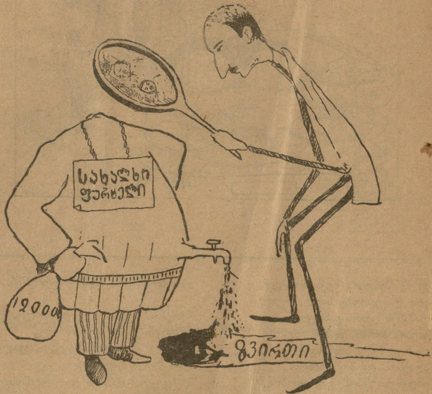
— საიდან მოდის ეს მღვრიე „გურიუა“? აი, სათავე!