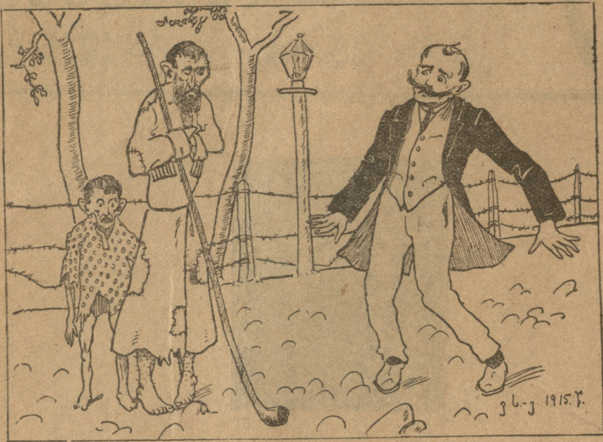
ლუკაშვილი. ღმერთო ჩემო რასა ვხედავ! შველა უნდა, შველა! ვაგონებო სადა ხართ?