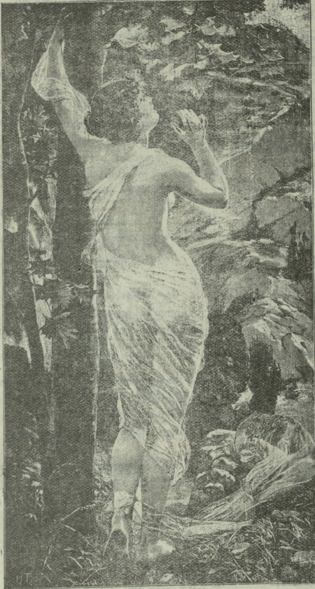
ქრისტეს აღდგომის ულოცავს სატრფოს.

დამეა, ბნელა, დუმილია, სწუხს აკე-მარე, შავ ჭანუ-ბურუსში გახვეულა ტეე მკლავიარე. სადღაც მარაგში მიმალულან მნათობნი ცისა, სიამაუენი და ნუგეში დედამიწისა. სიო არ იფერის, არ შრიალებს არცა ფოთოლი, შეჩერებულა მოუსვენარ კაცთა ჩრქოლი. შემწვადარა კლდისა ნაკადულის ნაზი ჩხრიალი, ბუმბურაზ მთისა სტიქიური ზვავის გრიალი. თითქო ქვეყნად არსებობს სრულად გამქრალა, სულაერთათვის ცხფრებისა წყარო დამშრალა. მხოლოდ იუდა დანავარდობს ეკლასი გზაზე. და იქ დარაჯნი ხარხარებენ გოლგოთას მთაზე. იქ ცოდვით სავსე დედამიწა სიღრმეში გმინავს, იქ დიდ ღოდის ქვეშ დამარხულსა დუთის მტნებას სძინავს.