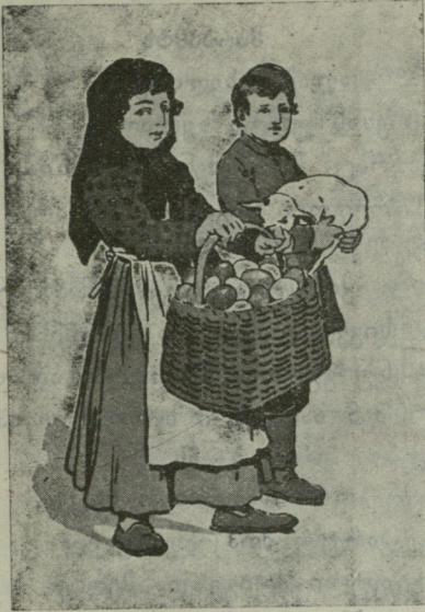
სააღდგომო ძღვენი ნათლიასთან.

როსხელ მუცელზე დაიკრა. გაახსენდა ძველი განვლილი დრო, როდესაც ცარიელი პურით ძლივს იძლობდა კუჭს, გაახსენდა აგრეთვე თავის ძველი ყოფილი ამხანაგები, რომელნიც ეხლა ვინ იცის რომელ მხარეს, რომელ კუთხეში დაფავენ სულს და ეს კი არხინად წამოწოლილა მხარ-თემოზე და მხოლოდ ქამა-სმაზე ფიქრობს. მამა ჯამულეთს ხან მოედრუბლებოდა სახე ამ მოგონებით და ხან კი ეშმაკურად ჩაიღიმებდა.