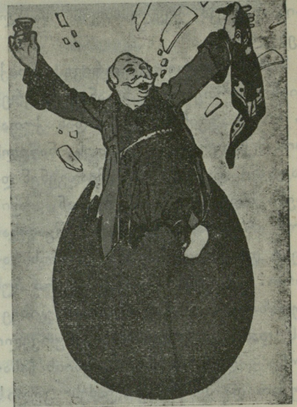
როგორ ეგებება აღდგომას მოქალაქე.

ინსტრუქცია და მერე მელაპარაკე!.. —მკვანთ მიუგო პოლიციელმა.