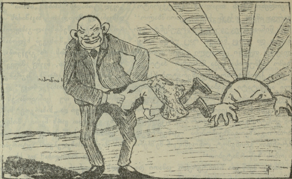
კორეა და იაპონია.