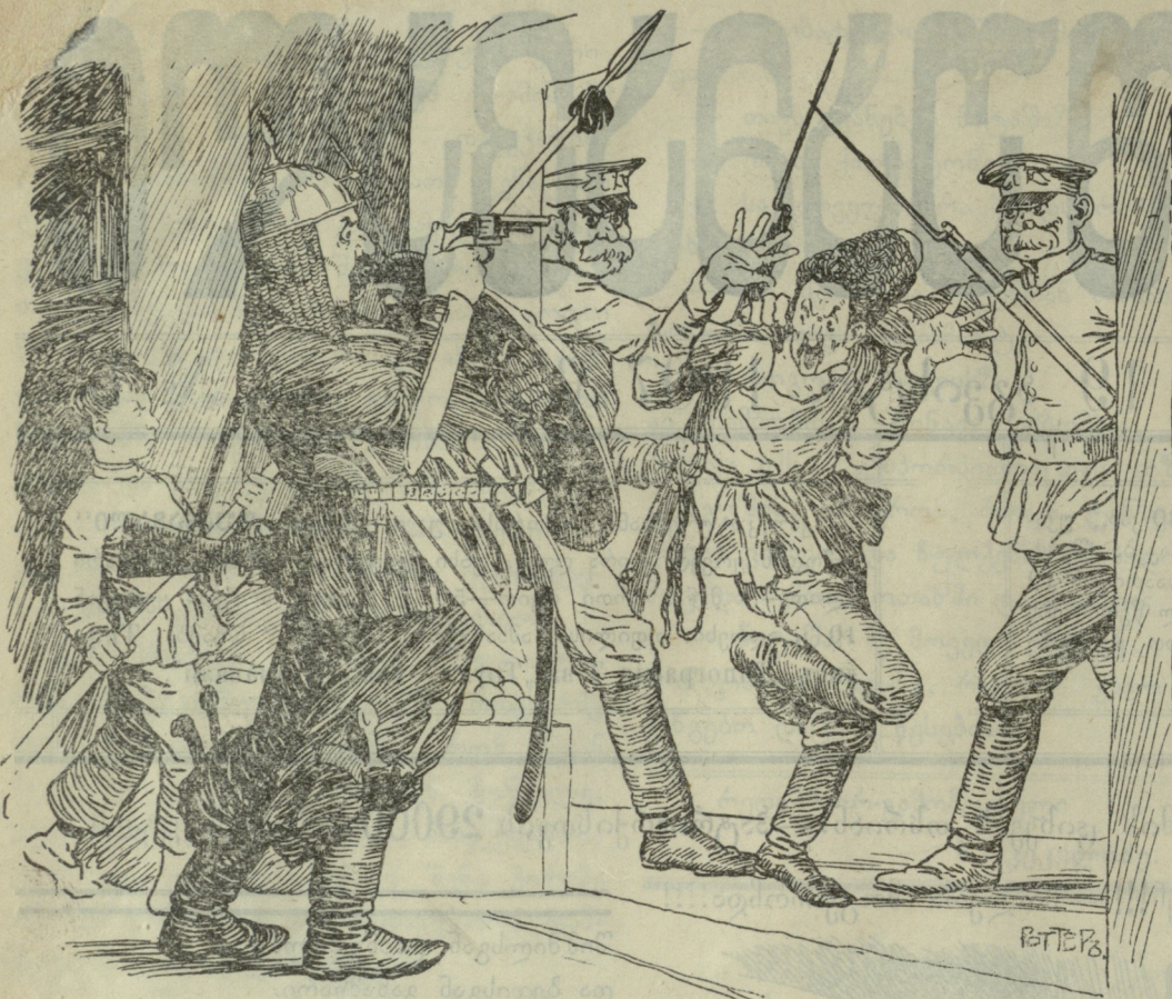
გეორგ დღეს მეცხრე ჟამზე გამოცხადდა „ტარიელი“.

უცებ, ეკლესიის ერთი კუთხიდან გულ-ამოსკვნილი და ხმა-მაღალი ტირილი მო-ისმა. მსმენელთა და მქადაგებელთა ყუ-რადღება დაუყოვნებლივ იქაუ მიიქცა. ერთი მოხუცი აფხაზი ცხარე ცრემლებს ღვრიდა და თანაც ჩუმი ხმით რაღაცას ბუტბუტებდა.