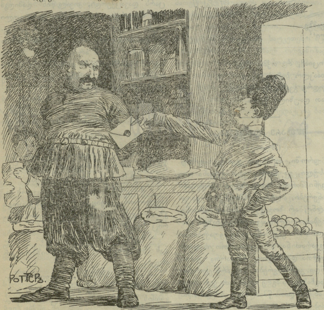
—წაიკითხე და გახსოვდეს: „ან ფული, ან სული!“

ამხადებენ!!—ანარქისტები კინკლაობენ!!!—სოლერა მოგვიჩინდა!!!!