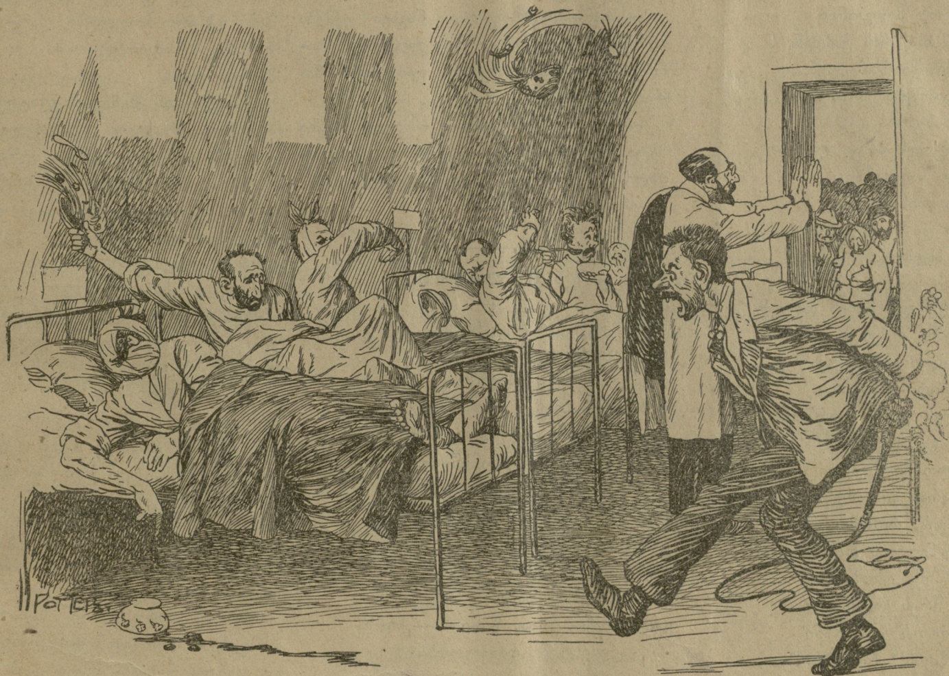
როცა უნდომნი ბუნტობენ მათრახი და მათი ჯანი...