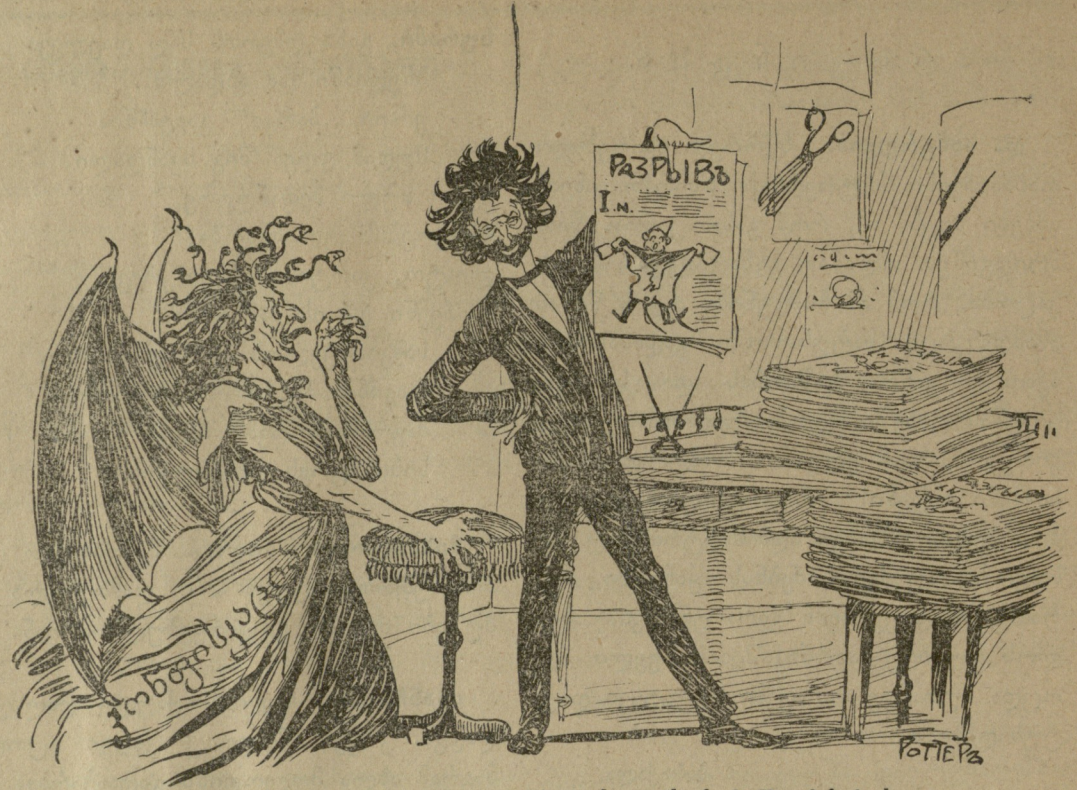
უჰ! უჰ! ცხელ ცხელი ნომრები! აბა! ქუჩაში ჩქარა!

შვალამეა. ცნობილ ბინას ბნელი ბურავს. ყველას ძინავს.