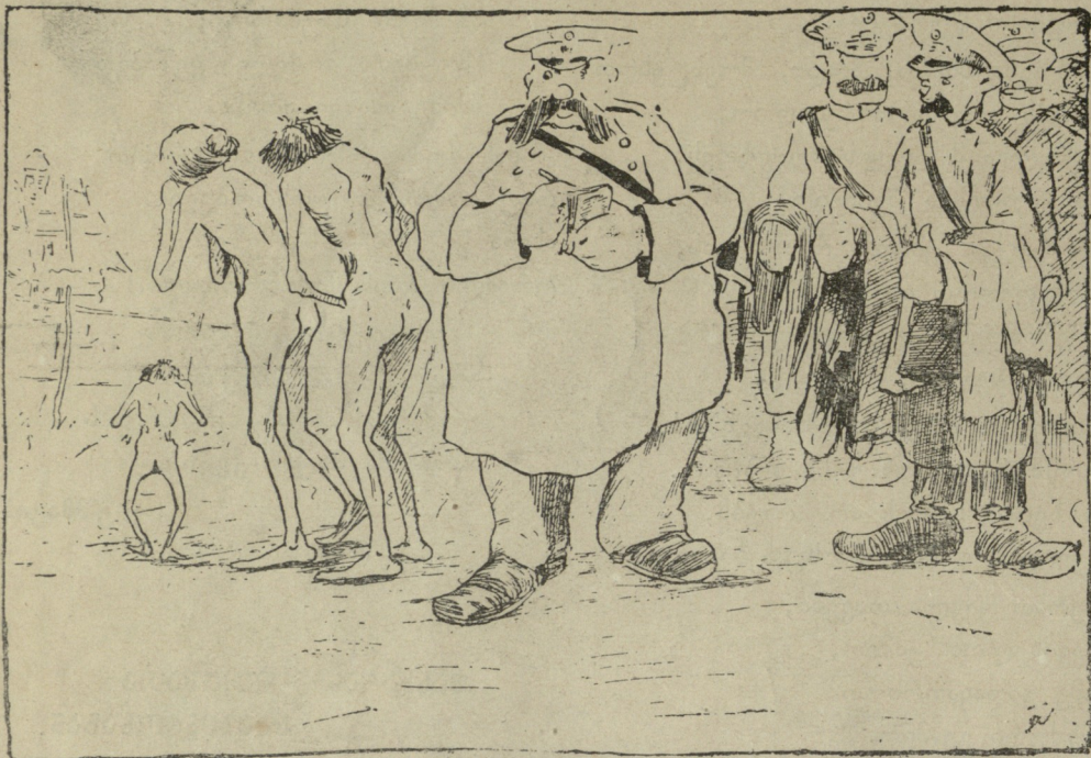
ნაბრძანებია: გადასახადები დაუყონებლივ გადავახდევინოთ და ჩვენც ვხდით...