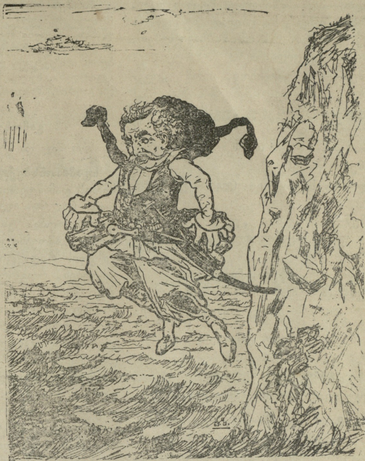
პირრი: ერთი ასეთი გამარჯვებაც და დავილუბე!