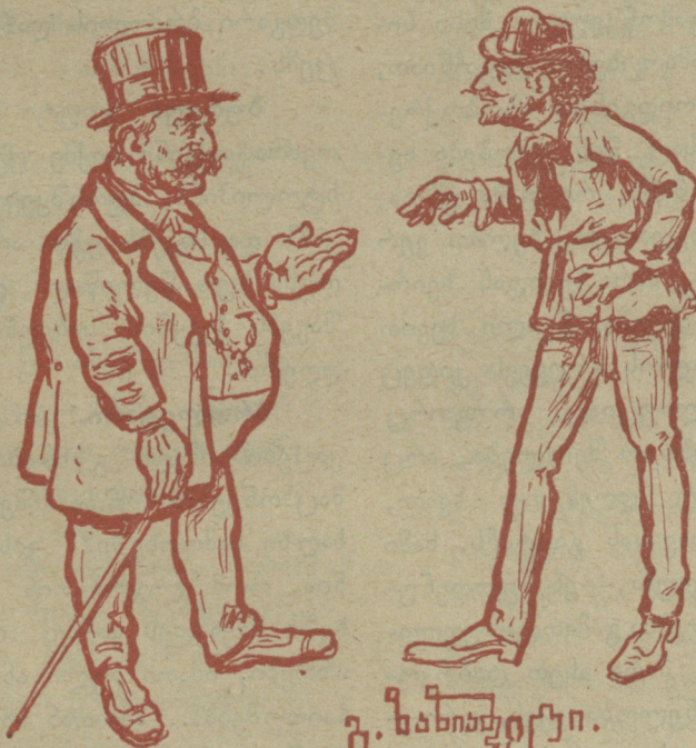
გ. შახინაძე იერქუი.