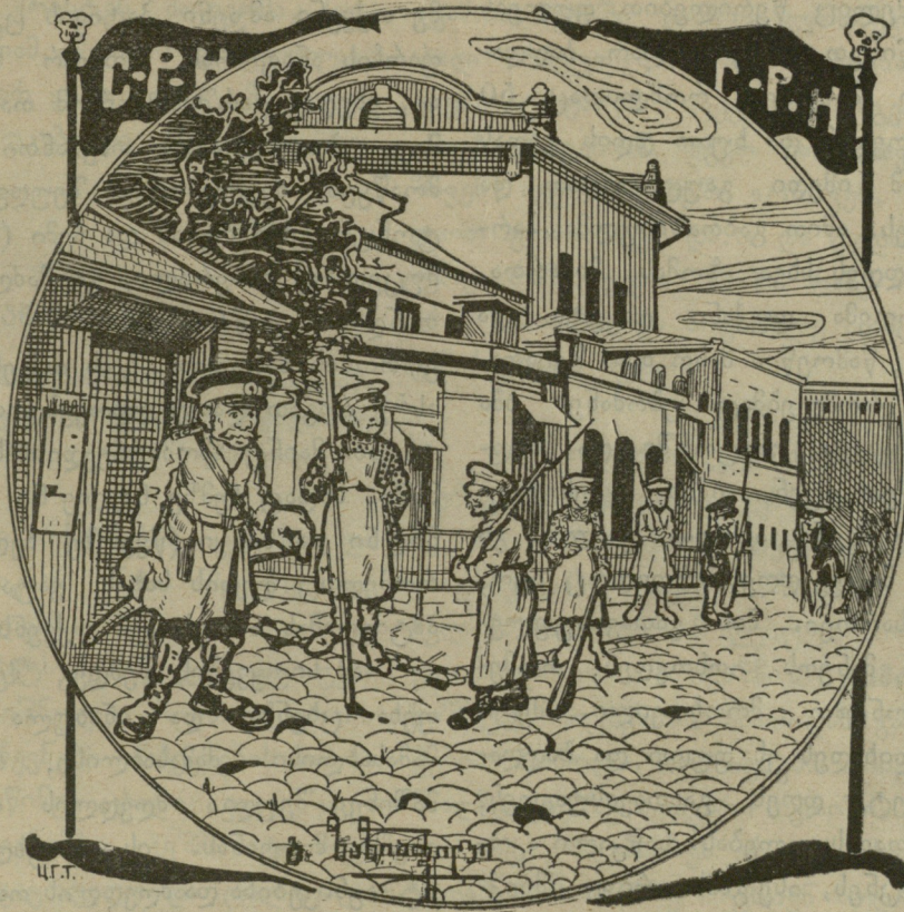
რუსთა კუროის ამრჩევლებს პალიცია იფარავს გარეშე გავლენისაჲან.