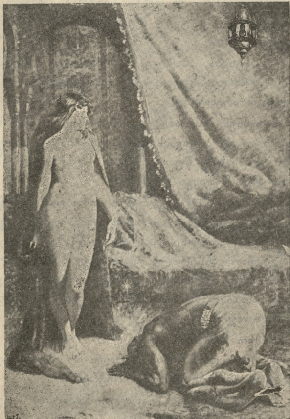
სათაყვანებელის გადმერთება ბუაერის ნახატი.

რა არის თავისუფლება? ძილში ნახული ტკბილი სიზმარია რუსეთის ხალხისათვის, ხოლო მთავრობისა და მისი აგენტებისათვის უფლება თვითნებობასა და ძალმომრეობაზე.