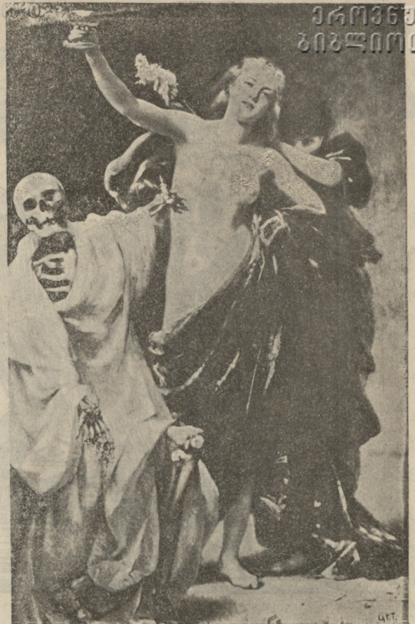
სსლგაზღობა და სიკვდილი დიუპუის ნახატი.