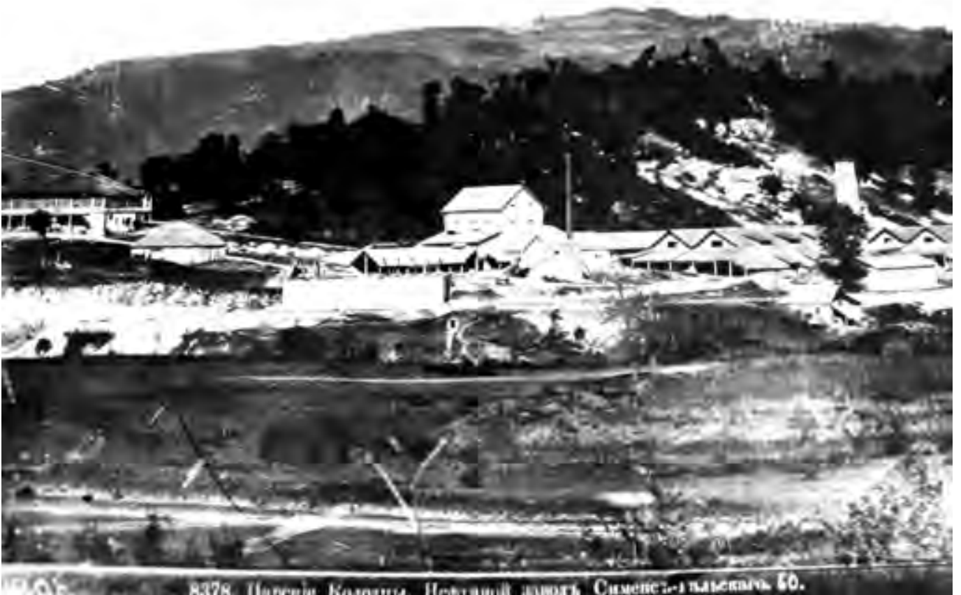
ნავთობგადამამუშავებელი ქარხანა დელოფლისწყაროში

მას 8 კაცი ემსახურებოდა. 1869-1876 წლებში აქ გადა- მუშავეს 6171 ტონა ნავთობი და მიიღეს 1221 ტონა ნავთი, 173 ტონა ბენზინი, 144 ტონა მძიმე ზეთი და 3420 ტონა ნარჩენები. სხვაობა გადამუშავებულ ნავთობსა და მიღე- ბულ პროდუქციას შორის შეადგენდა 1131 ტონას, რაც აორთქლებისა და სხვა მიზეზებით დაიკარგა. შემდგომში მათ გამოუმევეს გაზოილი, ლიგროინი, მანქანის ზეთები და ატარებდნენ ცდებს გამანათებელი გაზის მიღებაზე. ნარჩენებისაგან დაამზადეს ფისი, ყვარო სახურავებისათ- ვის, კოქსი, გუდრონი და ასფალტი. სხვათაშორის ვერნერ