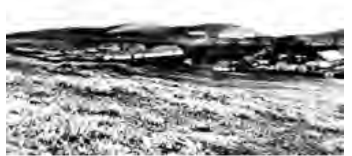
დედოფლისწყაროს ნავთობის გადამამუშავებელი ქარხნის საერთო ხედი

ნავთობის მოპოვება განსაკუთრებულად გაიზარდა ფირმა „სიმენსის“ საქართველოში შემოსვლის შემდეგ. სიმენსებმა თბილისის გუბერნიაში ქალაქ კუდაბეკთან, რომელიც ამჟამად აზერბაიჯანის ტერიტორიაზეა მოქცეული, ააშენეს სპილენძის გადამამუშავებელი ქარხანა, რომლის წარმოების გასაფართოებლად საწვავის მეტი რაოდენობა იყო საჭირო. გარშემო მდებარე ტყეების მოჭრით ბუნებას ზიანი ადგებოდა. ქალაქი მთიან რეგიონში მდებარეობდა და რკინიგზის ხაზი არ არსებობდა, რაც ორმაგად ართულებდა ბაქოდან ნავთობის გადაზიდვას. ალტერნატიული გზის მოსაძიებლად სიმენსებმა კავკასიის სამთო ნაწილის სამმართველოს მეშვეობით კახეთში, კერძოდ დედოფლისწყაროსა და მირზაანში ნავთობის საბადოების შესახებ ინფორმაცია მოიპოვეს. ამ საბადოებზე სამუშაოები 1863