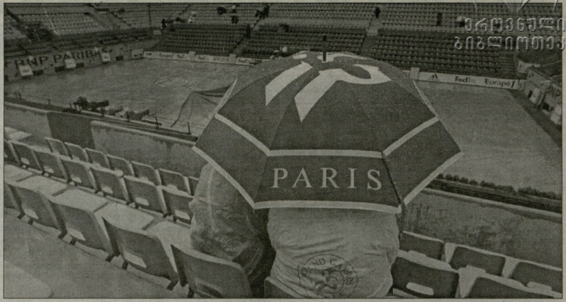
საფრანგეთის ღია პირველობა