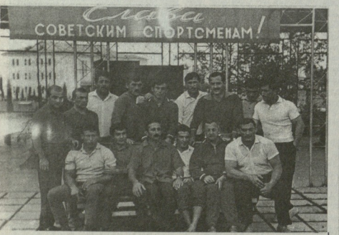
1964 წელი. ჟიური, კორორი ადულტო ტოკოსი XVIII ოლიმპიური თამაშების წინ. საქართველოს თავისუფალი, ავტონომიური სტატუსის მიზნების და დიპლომატიის წარმომადგენლები სსრკ-ის კავშირის ნაყვებში.

1963 წელს სოფლის X მსოფლიო ჩემპიონატის კლავში ჩინო ტურნის გეომოლოგიური კლავში მონაწილეობის შესაძლებლობა მათთვის არ იყო.