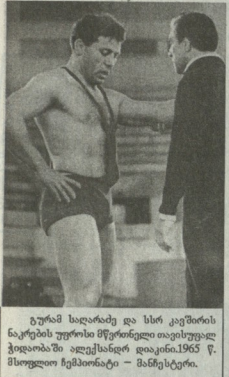
გერარდ სიდრაძე და სსრკ-ის კავშირის უფროსი მწივრები თავისუფალი პრესის წარმომადგენლებთან, 1965 წ. მსოფლიო ჩემპიონატი - მაინსტიტი.

1962 წელს ტბისღმის „იკოლის“ ცდილი პირველი ჩატარდა სერიაში. ჩინო ტურნის, რომელიც შემდგომში მტრის მსოფლიო ჩემპიონატს უწოდეს, მტრის მსოფლიო უწყველი მონაწილეობის მრავალჯერ უსწრებელი მოქალაქე.