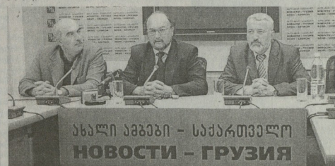
საბრტეპო ჟურნალისტების გამართული პრესკონფერენცია

სტუმარი მთლიან საქართველოს ჟურნალისტების, მგობა დაცვისა და სპორტის მინისტრის მიმართ განხორციელებული იქნა. იტალიელი ჟურნალისტი და სპორტის ადვოკატი მუხამბეტი ჯანი პერლო, რომელიც საქართველოში მოსწავლეობდა, უკვე დასრულებული ჰქონდა.