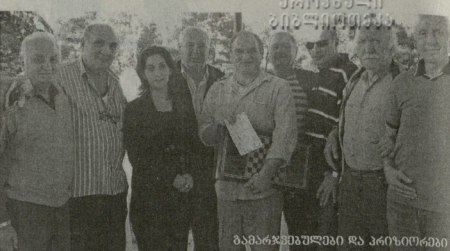
გაზეთების მსოფლიო პრესის ლეგიონები

ნას ახდენდა მის მიხედვით შესაძლებლობებს და ბრძოლისუნარიანობაზე რუბიკონი მასაც გადამავდებდა. აღარ მინდა დეტალებში შევიქნები არაბრძოლის პირდაპირ, მაგრამ ერთი მინდა შევასახე ჩემს მსოფლიო ჩემპიონატს. დინამიკური და სწრაფი იყო. მინდა შევასახე ჩემს მსოფლიო ჩემპიონატს. დინამიკური და სწრაფი იყო. მინდა შევასახე ჩემს მსოფლიო ჩემპიონატს. დინამიკური და სწრაფი იყო.