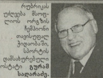
რუსიკის ქვეყნის მოხელის ორგანიზაციის იურიდიული კლავში, სსრკ-ის დამსახურებული ისტორიკოსი გერარდ სიდრაძე.

1962 წელს ტბისღმის „იკოლის“ ცდილი პირველი ჩატარდა სერიაში. ჩინო ტურნის, რომელიც შემდგომში მტრის მსოფლიო ჩემპიონატს უწოდეს, მტრის მსოფლიო უწყველი მონაწილეობის მრავალჯერ უსწრებელი მოქალაქე.