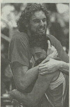
ნაგებობის გადასვლაზე ბრუკ სტანი გარდაცვალებული ჩემპიონი იყო

ამერიკელი დარღვეული კალიფორნიელი გარდაცვალებული ჩემპიონი ბრუკ სტანის ნაპირადაა დასაფლავებული