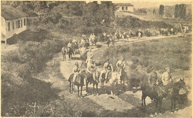
სახალხო გვარდიის არტილერიის შესვლა სოჭაში.