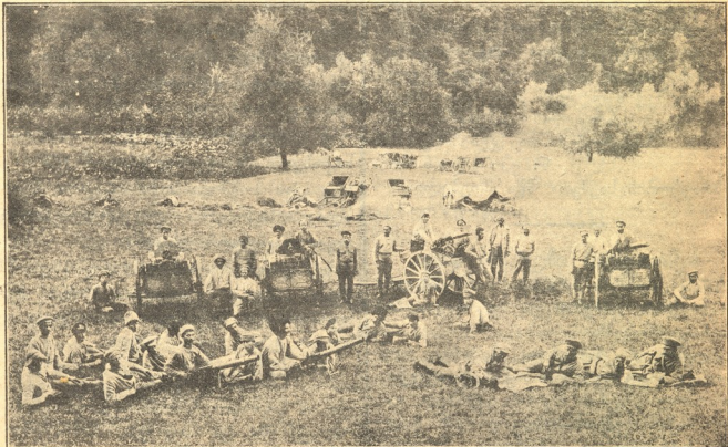
სახალხო გვარდიელები შავი ზღვის სანაპიროს მიმართულებით.