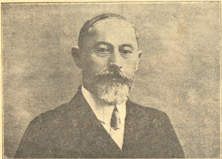
ნ. ნ. ჯორჯანი.

(სამხ. სამინისტროს განკარგულებაში არსებული ლიტერატურულ-სამეცნიერო განყოფილებით)