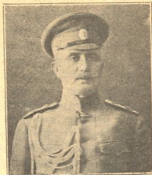
გ. ტ. გიორგაძე.

საქართველოს რესპუბლიკის სამხედრო მინისტრი