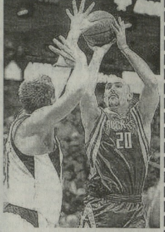
„ფინიქსის“ შემადგენელმა საკუთარი იტალიის წინააღმდეგ 34 ქული დაეკავა და 6 შედეგიან დახმებას შეასრულა. „ადვანსს“ ვერ უშველა ნიუტონს, რომლის ანგარიშზე 27 ქულია.

გერმანულ ფინიქსის შემადგენელი იტალიის პირველ შემადგენელს, მკვიდრს დამაკრებელს გამარჯვება მოუპოვა — 114:103. „ფინიქსი“ სტუმრად შეხვდა „საბრინჯის“ (დამარცხდა — 93:87. მისი ერთადერთი შედეგი — 31 ქული უდგინა იტალიის წინააღმდეგ — 103:92. ხოლო „ფინიქსი“ „საბრინჯისთან“ მატჩში სულ სერიოზულ დაწინაურდა — 116:98. ნაოსნო ფლი-ოუზი დაიწყო პირველი დროის მიხედვით „ადვანსის“ საშინაო მატჩი „სპორტივოსთან“ — 86:98. საბრინჯისთან, რომ მანამდე „ადვანსს“ ზღვივად 9 მატჩი ჰქონდა მიგვიტოვა რეგულარული ჩემპიონატი.